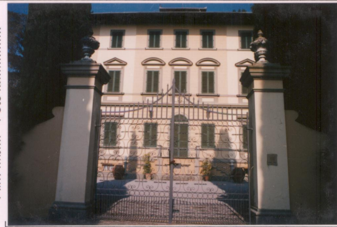
Film 595. Foto 3.....