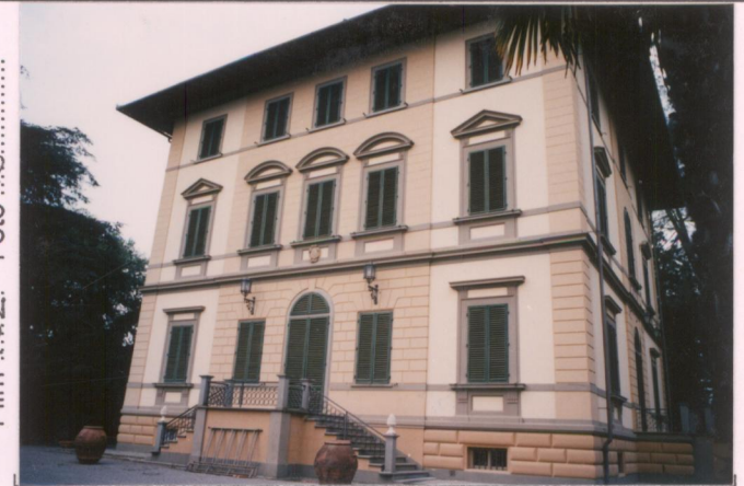
Film 702. Foto 18.....