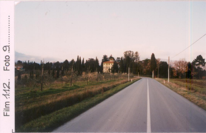
Film 112. Foto 9.....