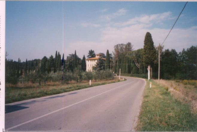
Film 595. Foto 4.....