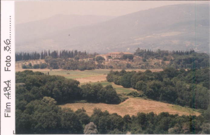
Film 484 Foto 36