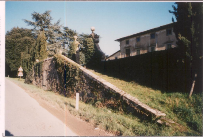
Film 104 Foto 27A