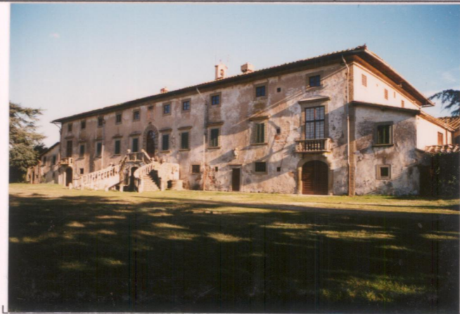
Film 104 Foto 26A