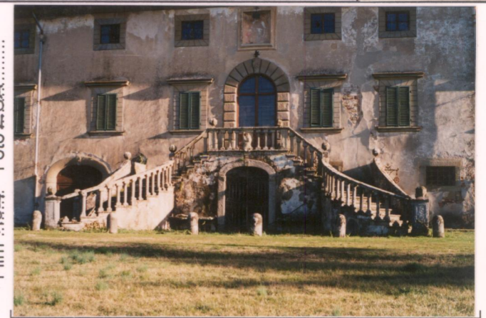
Film 104 Foto 28A