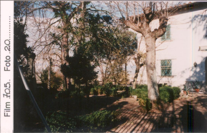
Film 705. Foto 20