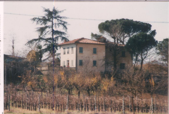
Film 705. Foto 17