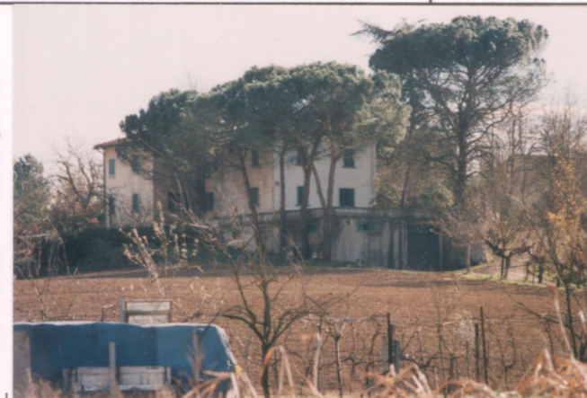
Film 705. Foto 18