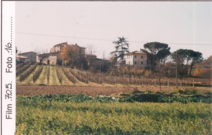
Film 705. Foto 16