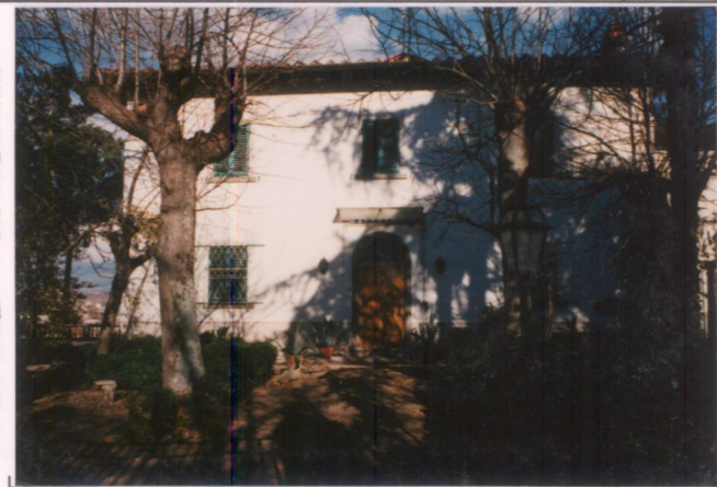
Film 705. Foto 19