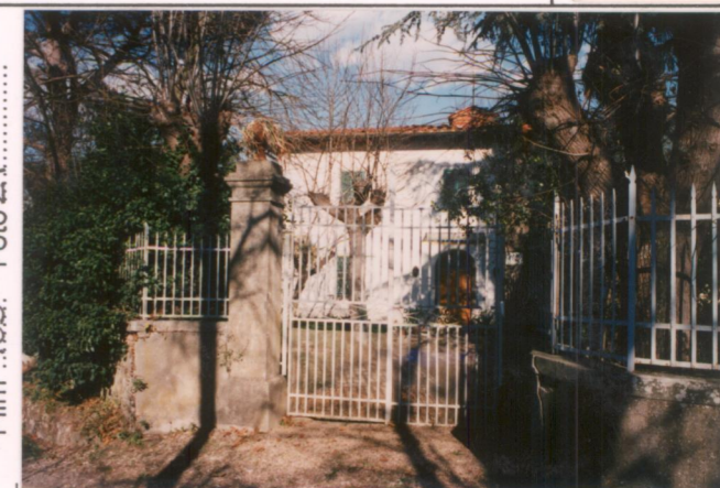
Film 705. Foto 21