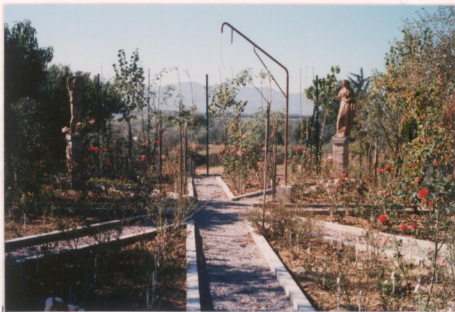
p.v. N. 9. idem