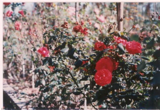
p.v. N. 11. idem