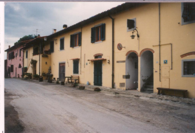
Film 239. Foto 25.....