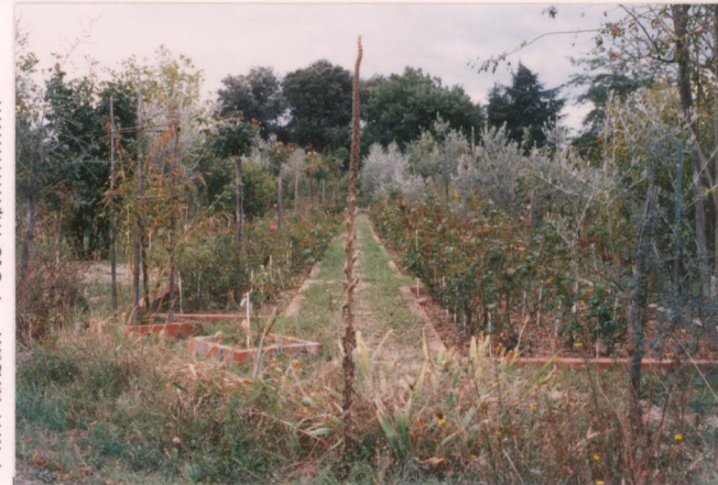
p.v. N. 8. idem