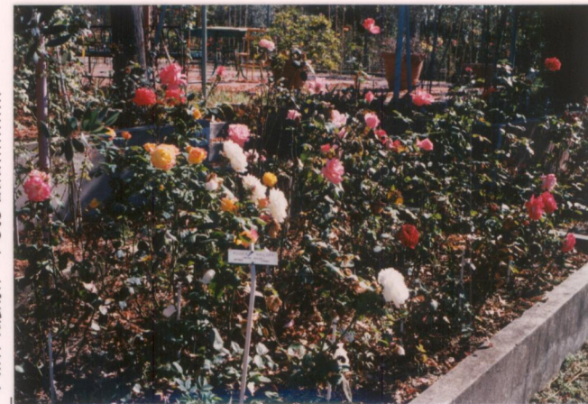
p.v. N. 12. idem