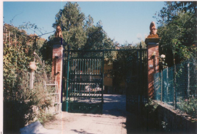
p.v. N. 6. Ingresso alla villa