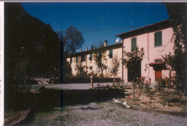
Film 597. Foto .12.....