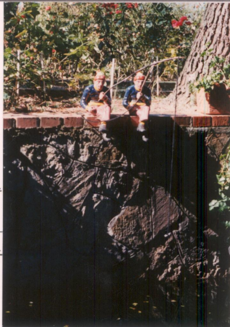
p.v. N. 13

Particolare della vasca vicino all'ingresso secondario