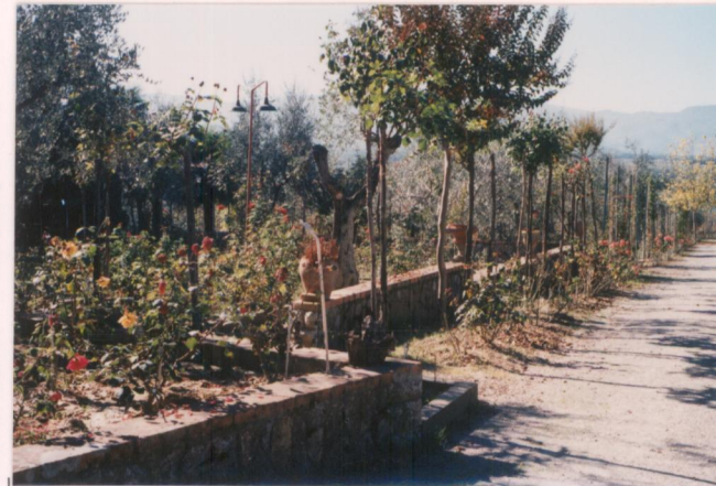
p.v. N. 7. Roseto