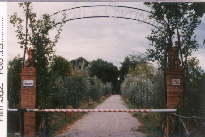
Film 582. Foto .13.....