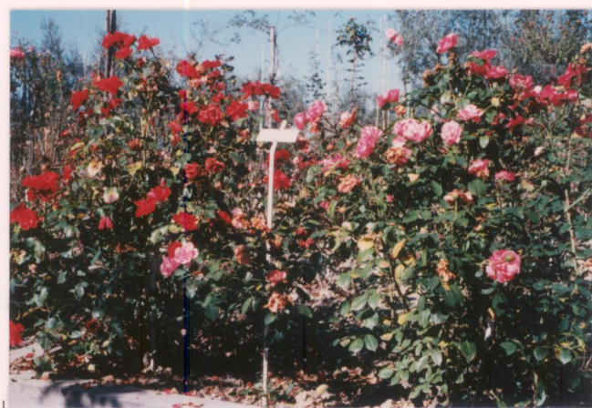
p.v. N. 10. idem