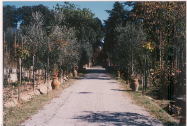
p.v. N. 5. Viale di ingresso alla villa