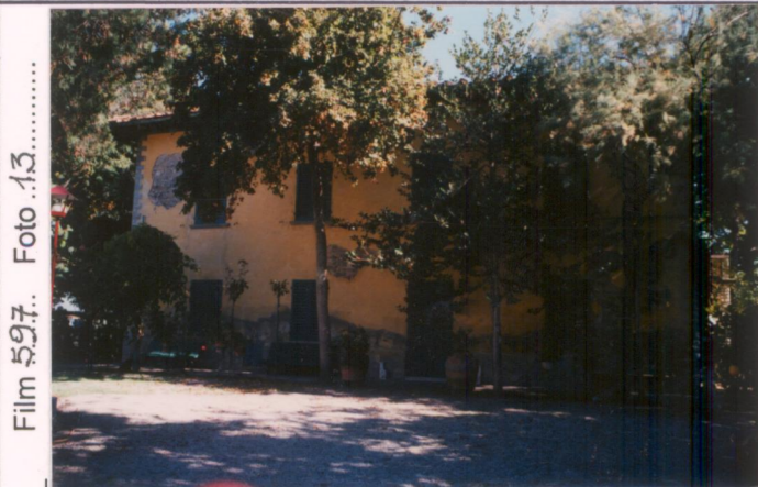
Film 597. Foto .13.....