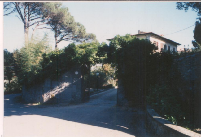
p.v. N. 3. Ingresso ovest