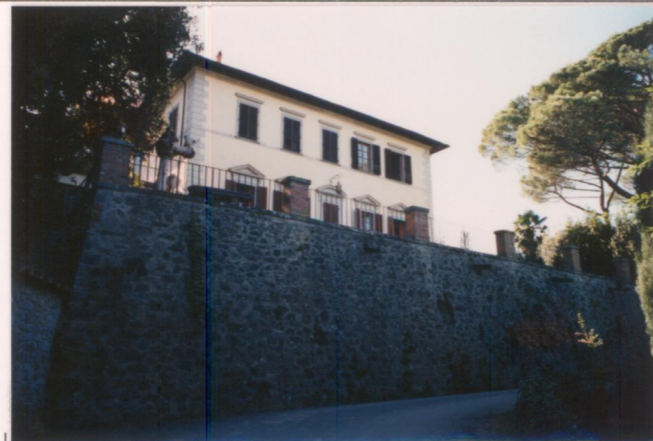
p.v. N. 2. Fronte nord