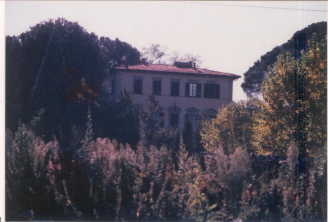
p.v. N. 1. Veduta dalla Statale 69