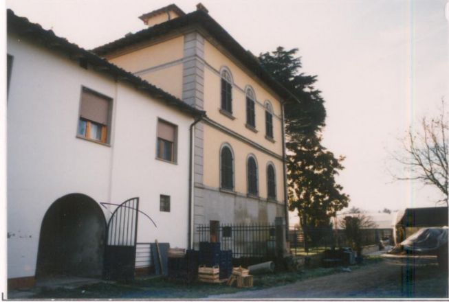
p.v. N. 5...Fronte...ovest.....