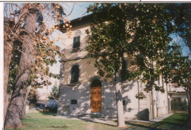
p.v. N. 3. Fronte principale (sud)