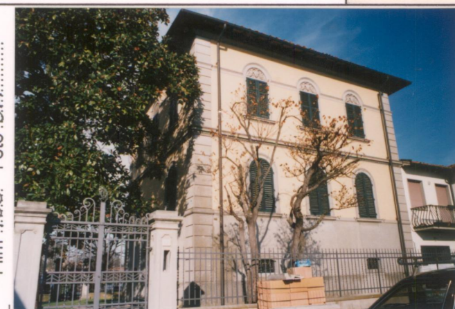
p.v. N. 4. fronte est