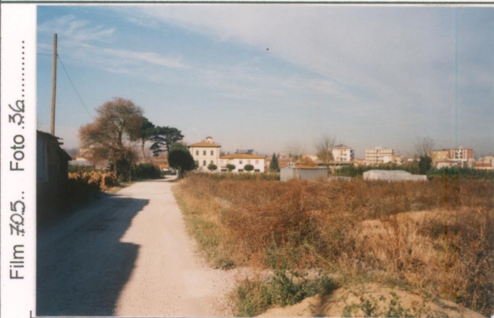
p.v. N. 1. Veduta da Le Case Romole