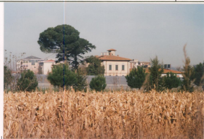
p.v. N. 2. Idem