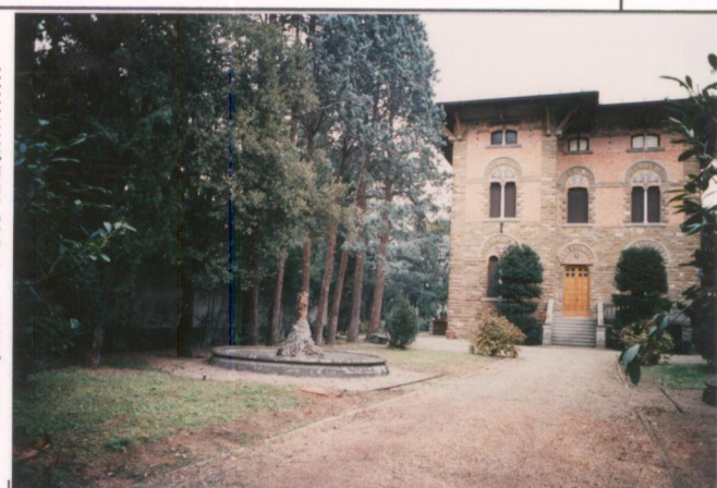
Film 703. Foto 21. p.v. N. 2.