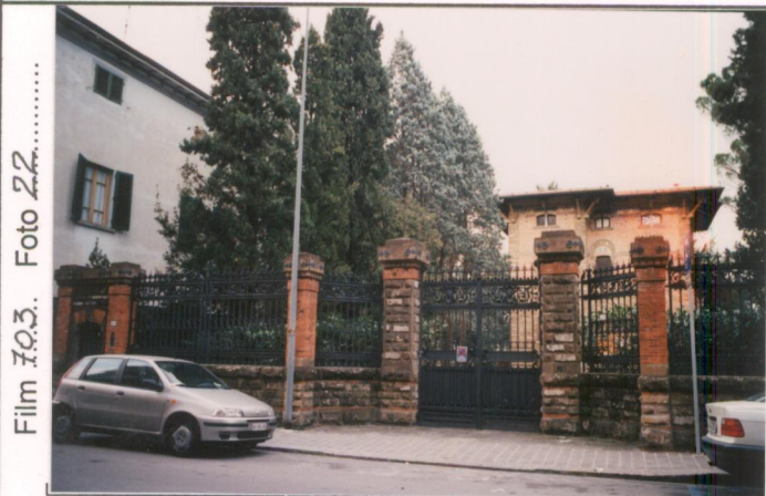
Film 703. Foto 22. p.v. N. 1.