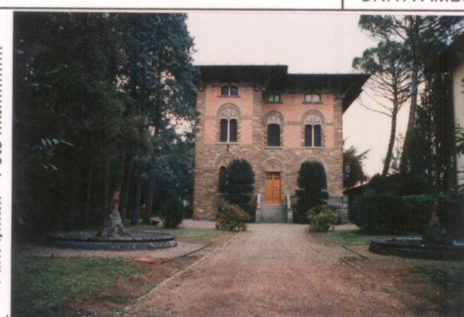
Film 703. Foto 20. p.v. N. 3.