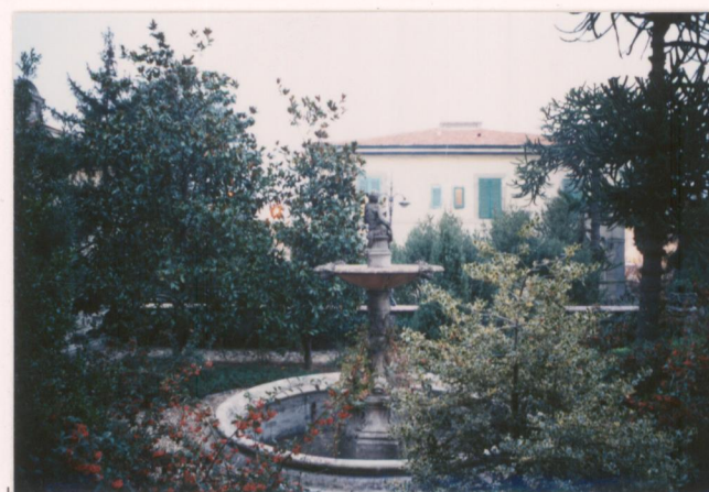
Film 703... Foto 34