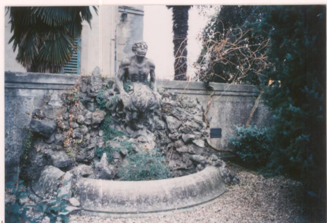
Film 703... Foto 32