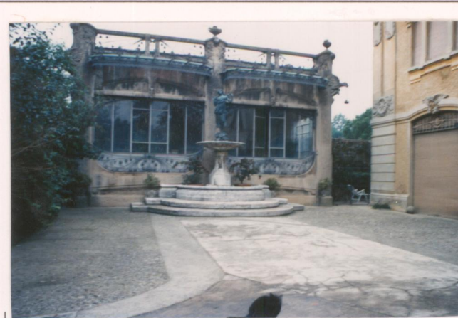
Film 703... Foto 31