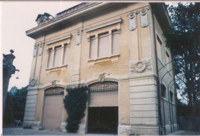
Film 703... Foto 30