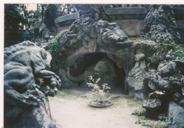
Film 703... Foto 27