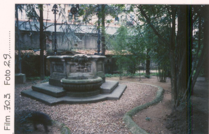
Film 703... Foto 29