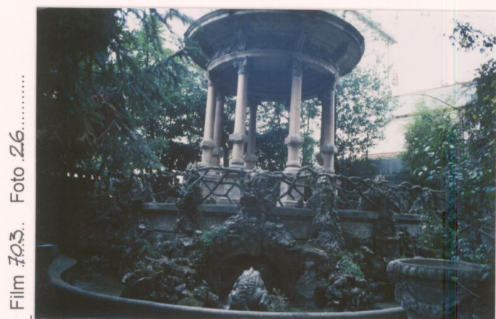
Film 703... Foto 26