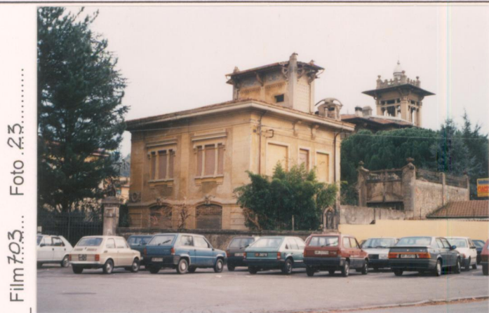
Film 703... Foto 23