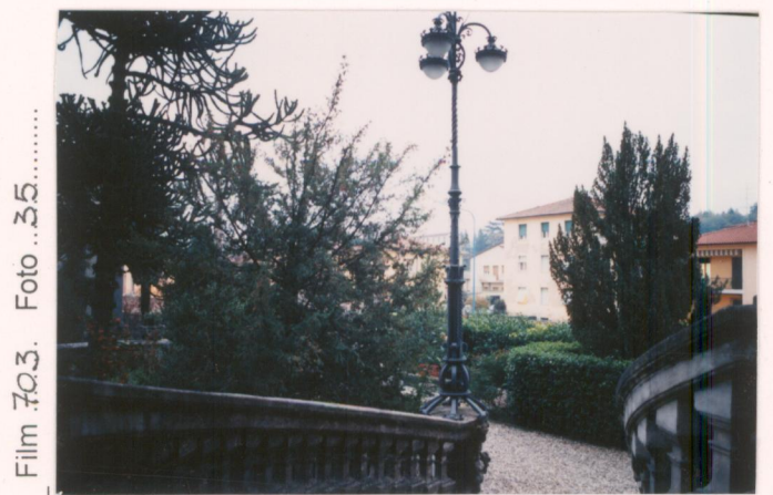
Film 703... Foto 35