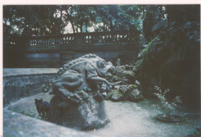
Film 703... Foto 25