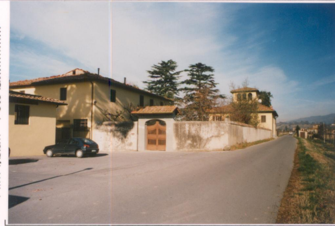
Film 706. Foto 3A.....