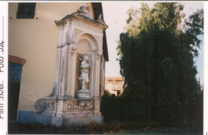
Film 706. Foto 5A.....