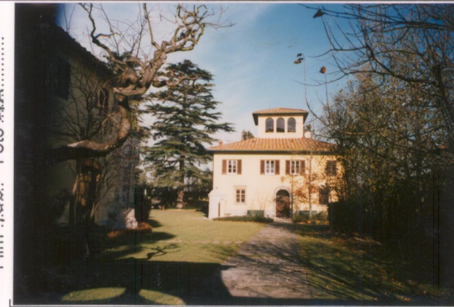
Film 706. Foto 4A.....