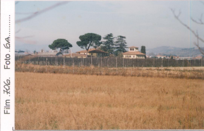
Film 706. Foto 6A.....