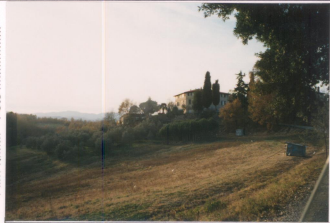
Film 707. Foto 5A.....