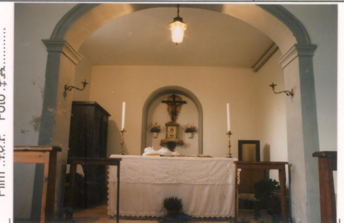
Film 707. Foto 7A.....