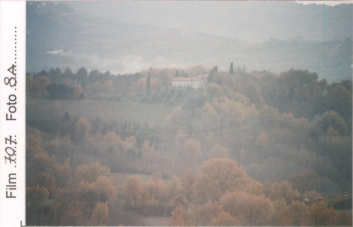
Film 707. Foto 8A.....