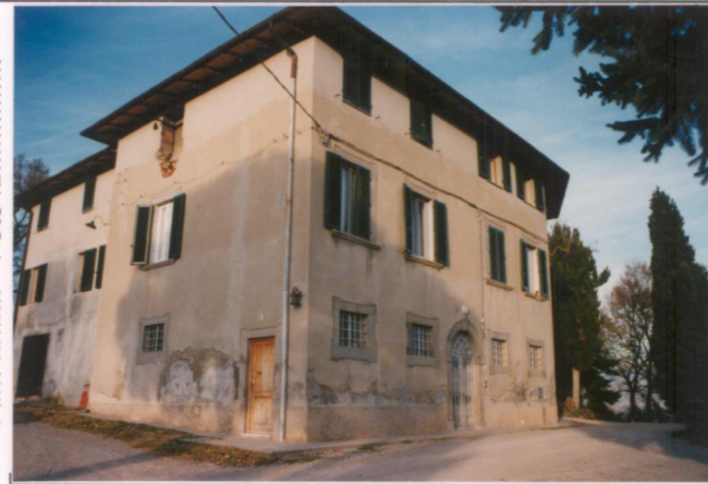
Film 707. Foto 6A.....