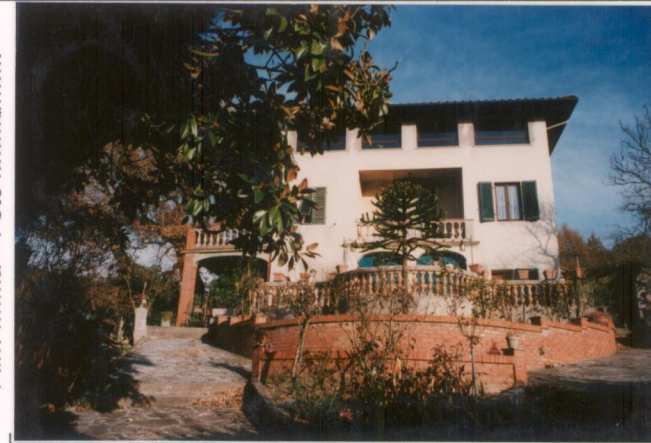
p.v. N. 3... Fronte ovest.....