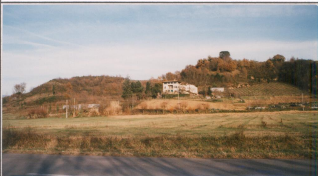
Film 706 Foto 34A p.v. N. 5 Veduta dalla provinciale