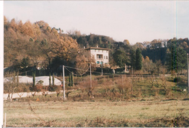
p.v. N. 1... Veduta dalla provinciale.....