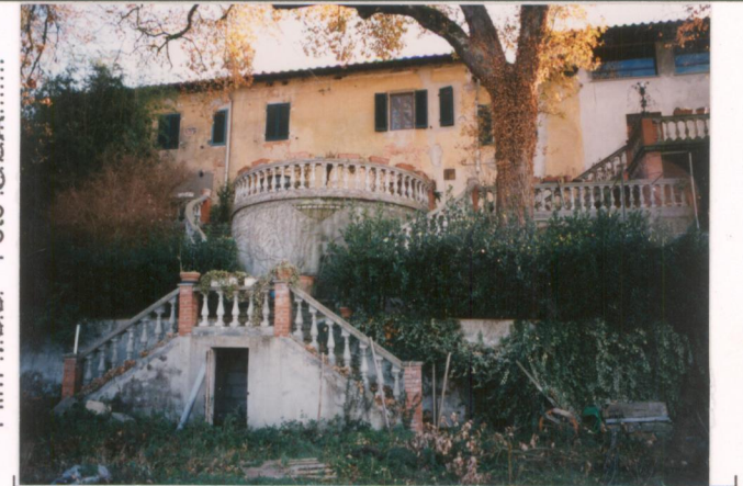
p.v. N. 4... Sistemazione giardino a nord.....