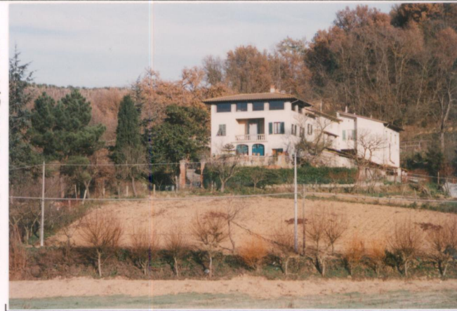
p.v. N. 2... Idem.....