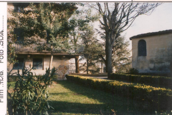
p.v. N. 4. Veduta del giardino da ovest