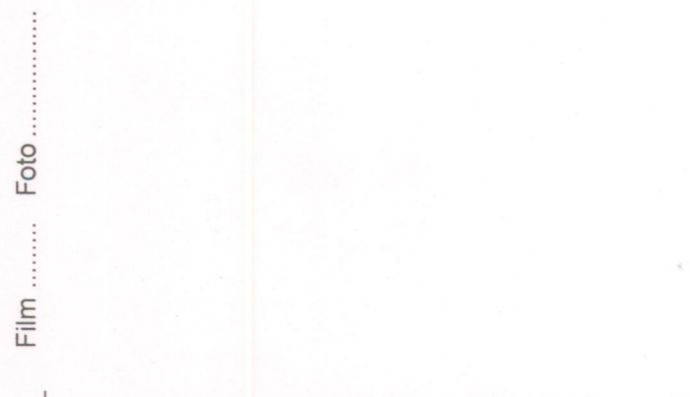
Film ..... Foto ..... p.v. N. ....