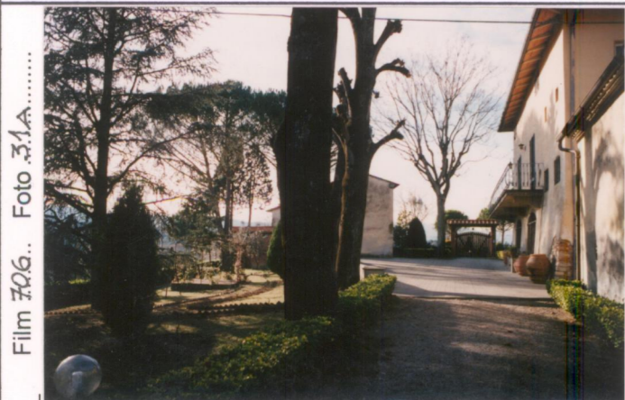
Film 706.. Foto 31A..... p.v. N. 5...Il giardino di fronte alla fattoria