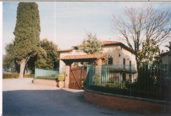
p.v. N. 2. Fronte ovest