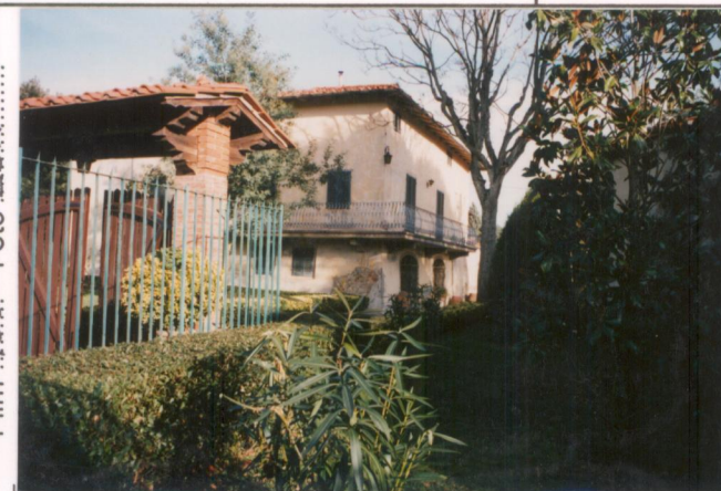
p.v. N. 3. La fattoria vista da ovest