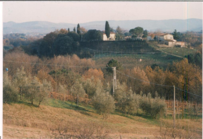
p.v. N. 1. Veduta dalla strada dei Salvatici