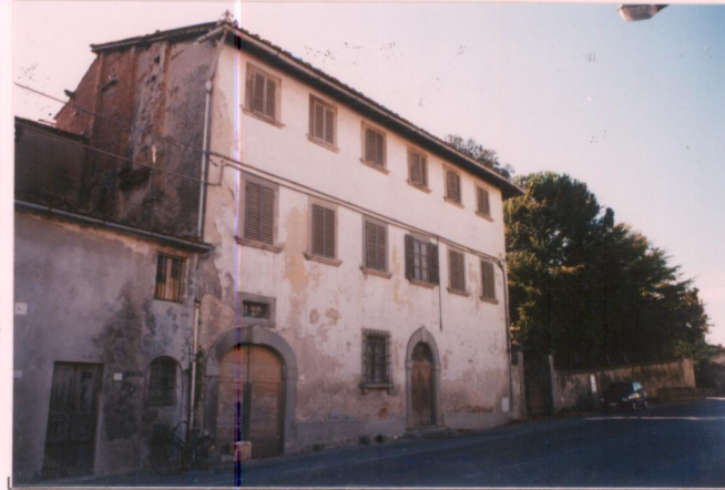
Film 598 Foto 0A