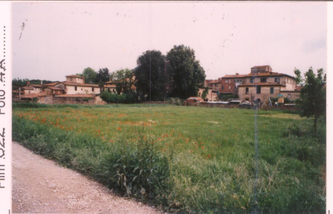
Film 322 Foto 4A