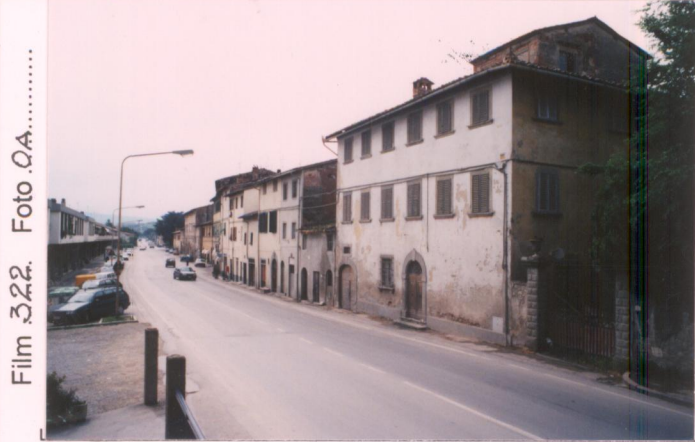
Film 322 Foto 0A