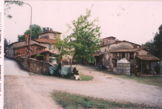
Film 322 Foto 2A