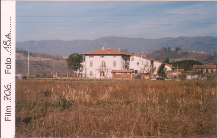
Film 706. Foto 18A.....