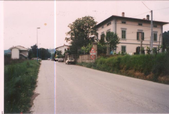
Film 523. Foto 25A.....