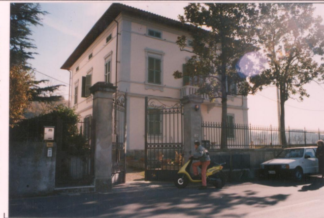
Film 706. Foto 17A.....