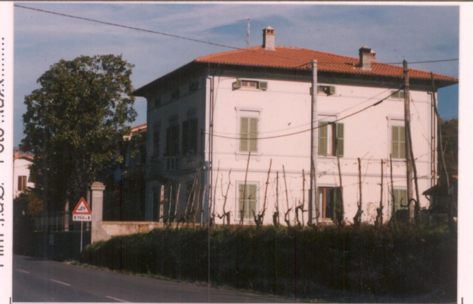
Film 706. Foto 16A.....