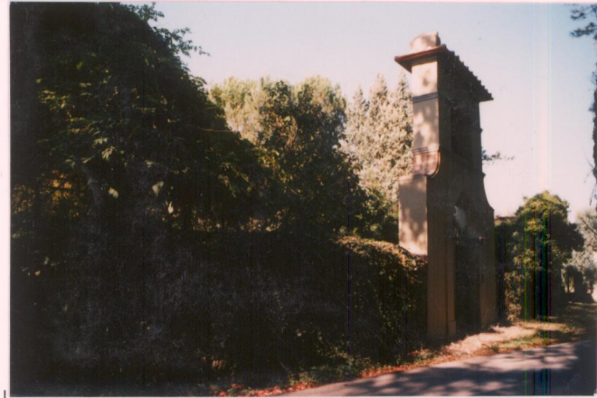
p.v. N. 5...Ingresso e pergola (sinistra).....