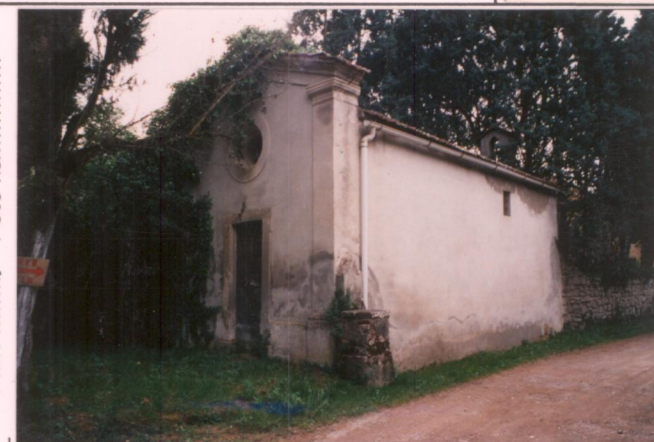
Film 32.4 Foto 3.A..... p.v. N. 4. Cappella.....