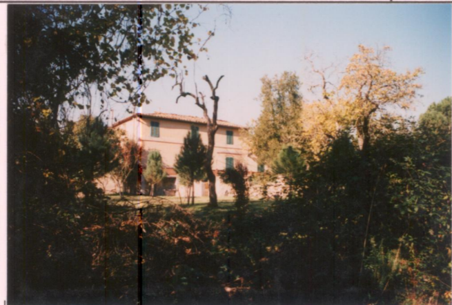
Film 70.1. Foto 25..... p.v. N. 2. Il giardino e la villa.....