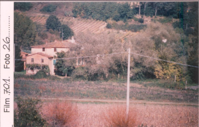
Film 70.1. Foto 26..... p.v. N. 1. Veduta dalla strada di Caposelvi.....