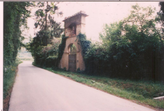
Film 32.4 Foto 2.A..... p.v. N. 3. Ingresso.....