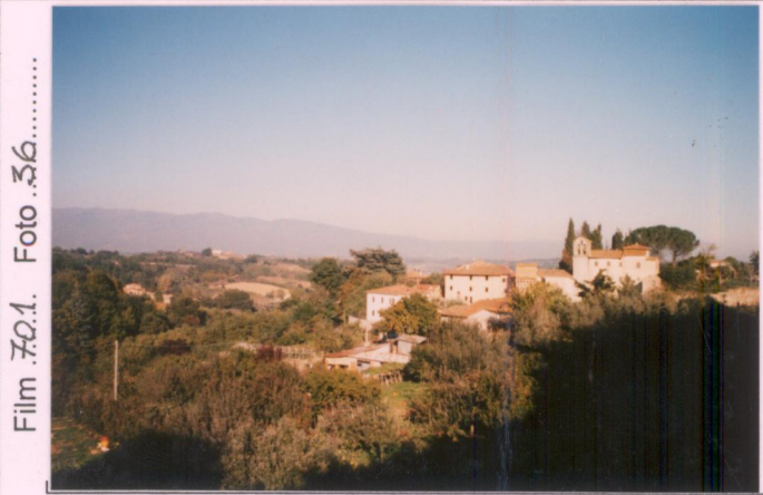
Film 70.1. Foto 36.....