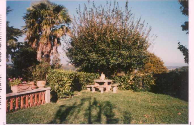
Film 701. Foto 31.....