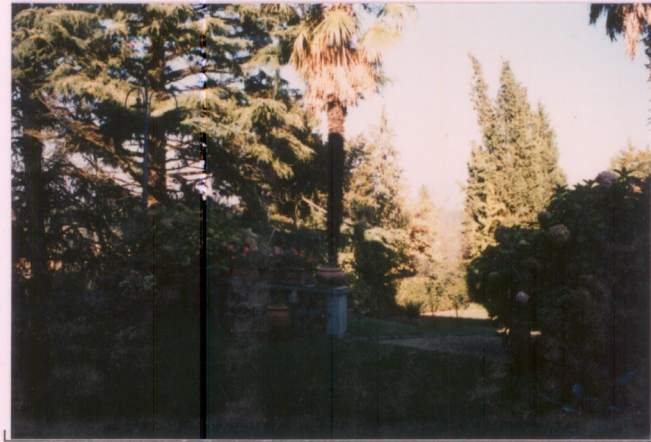
Film 701. Foto 30.....