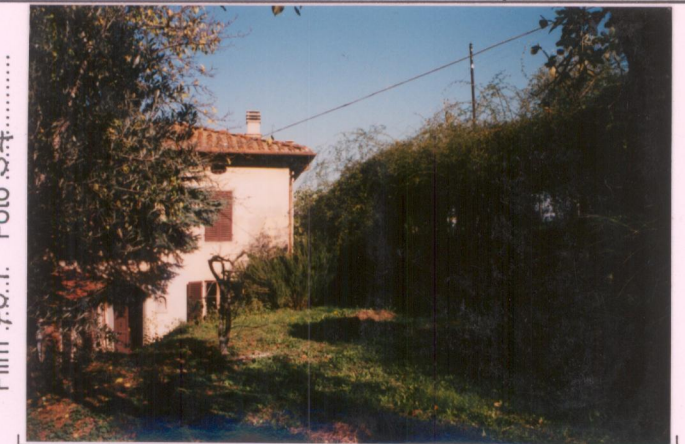
Film 70.1. Foto 34.....