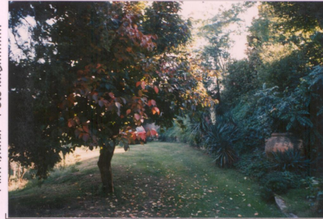
Film 701. Foto 29.....