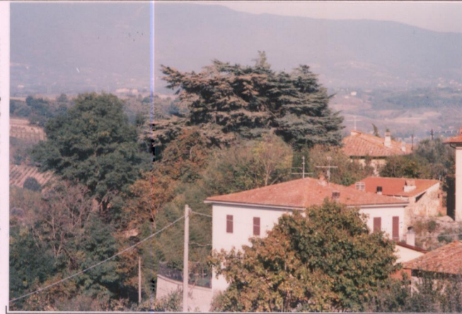
Film 70.1. Foto 35.....