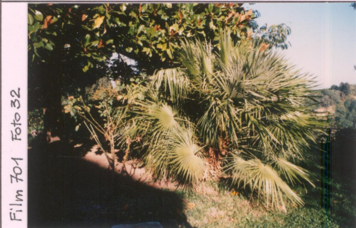
Film 701 Foto 32