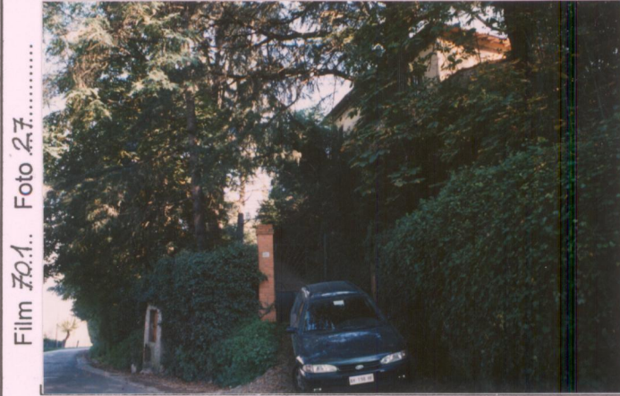
Film 701. Foto 27.....