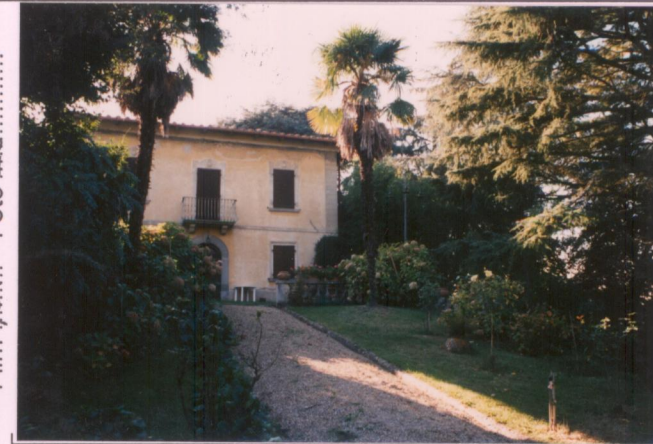
Film 70.1. Foto 28.....