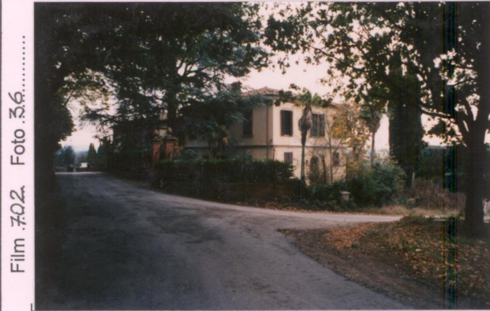
Film 702 Foto 36