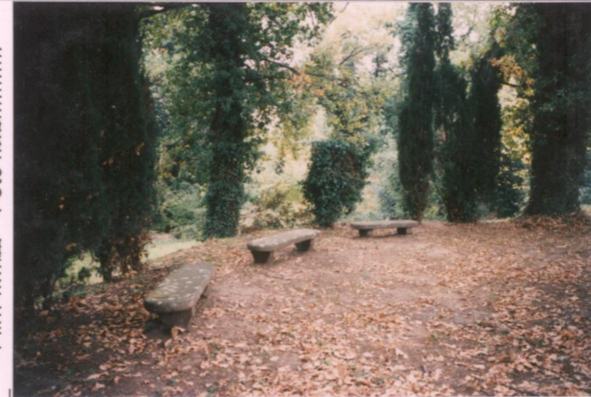
Film 702 Foto 35