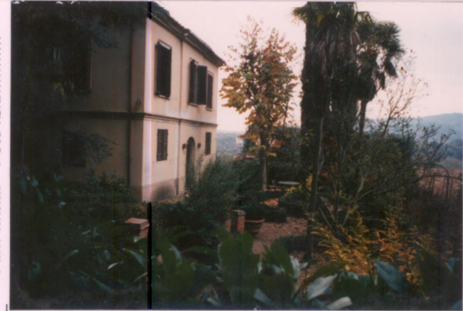
Film 702 Foto 37