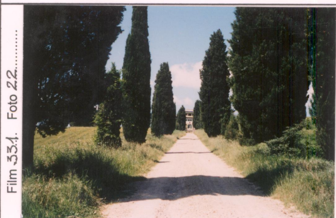
p.v. N. 1. Viale di accesso alla villa.....