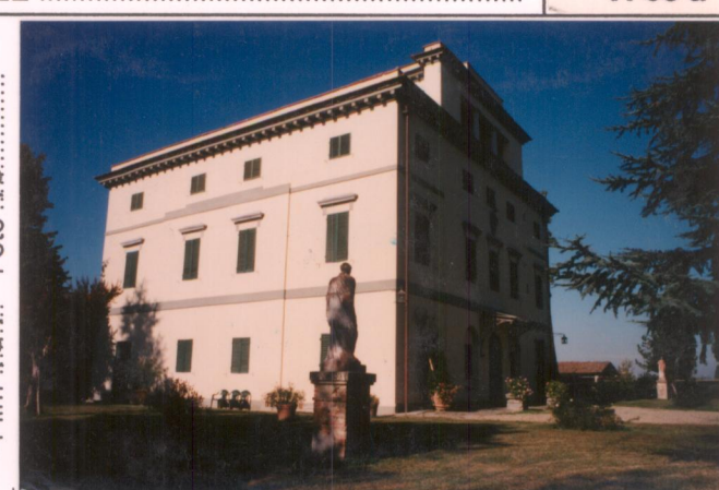
p.v. N. 4. Veduta da sud.....