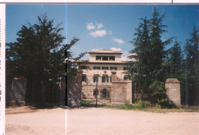
p.v. N. 2. Frante est ed ingresso.....