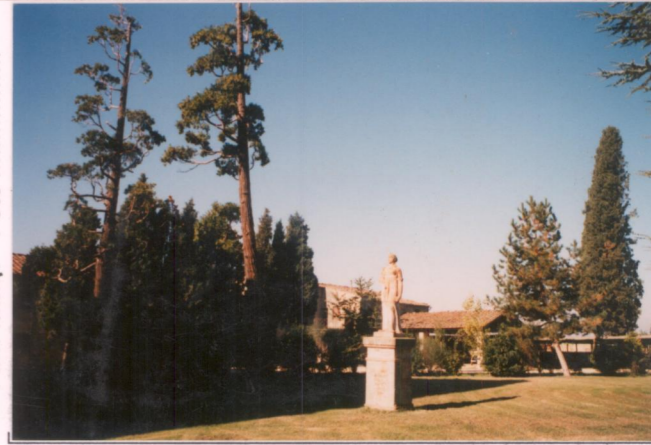
p.v. N. 8...Il giardino a nord.....