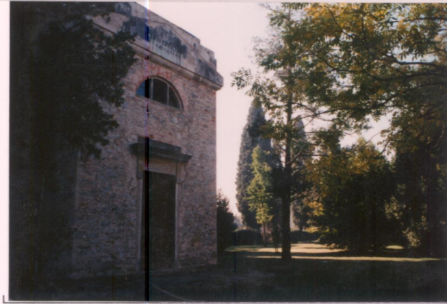
p.v. N. 6...Cappella.....