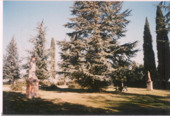
p.v. N. 7...Zona del giardino...ad est...della...villa....