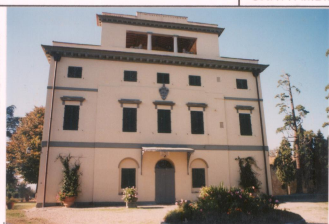
p.v. N. 3. Idem.....