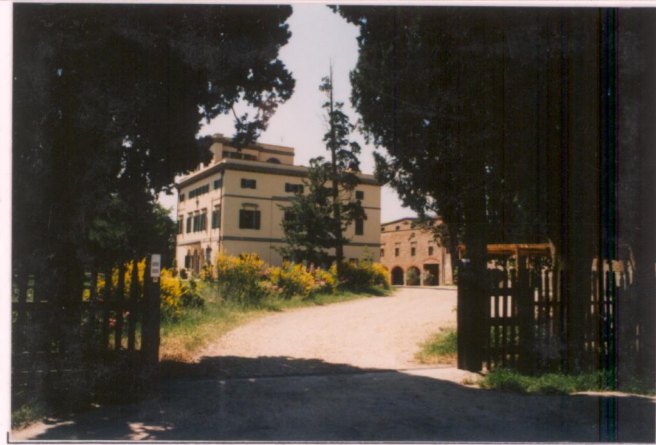
p.v. N.5...Ingresso...a nord...della...villa.....