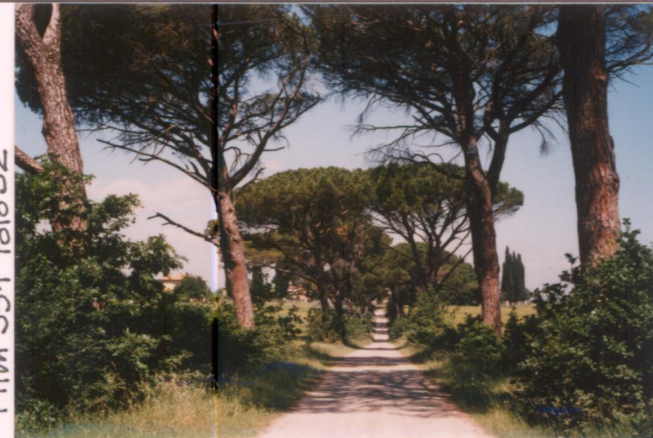
p.v. N.10 Idem, visto da sud.