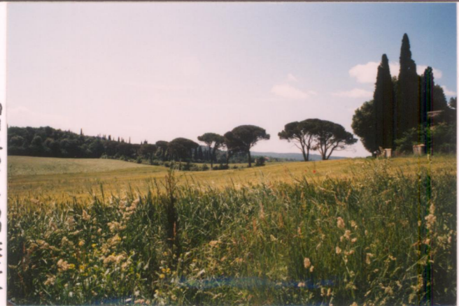
p.v. N.9 Viale con pini fra la villa e il Roccolo visto dalla villa