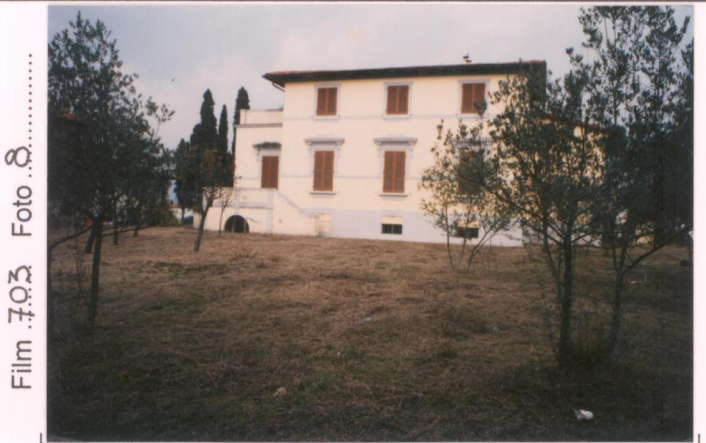
Film 703 Foto 8 p.v. N. ....