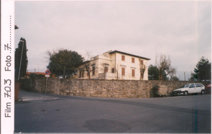
Film 703 Foto 7 p.v. N. ....