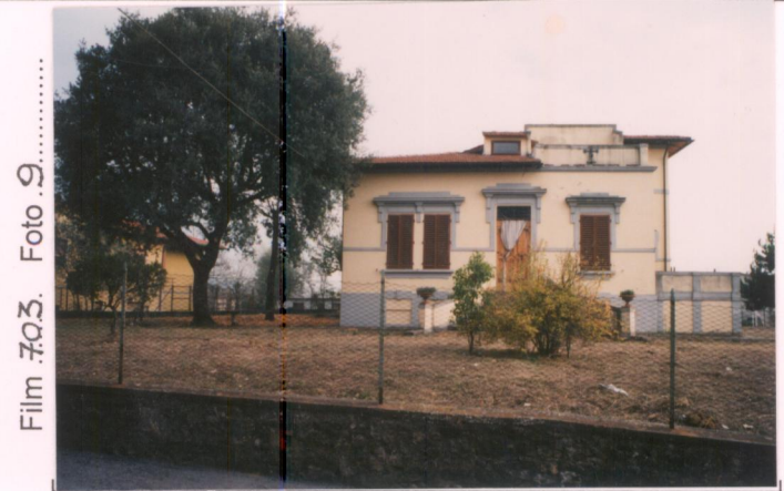
Film 703 Foto 9 p.v. N. ....