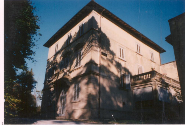
p.v. N. 3. Fronte ovest della villa.....