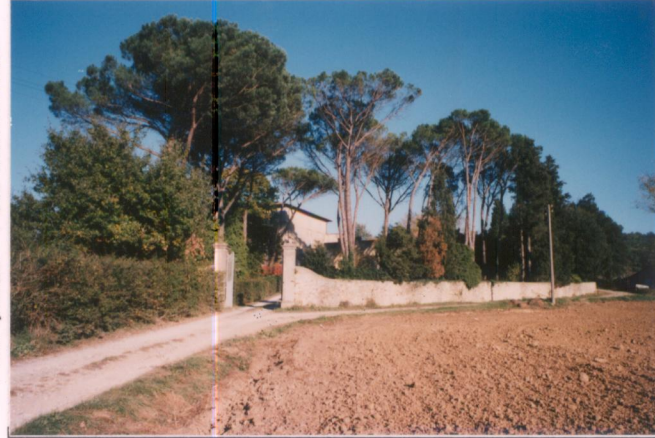
p.v. N. 2. Ingresso alla villa.....