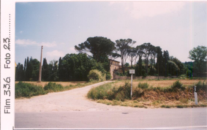
p.v. N. 1. Veduta dalla strada statale.....