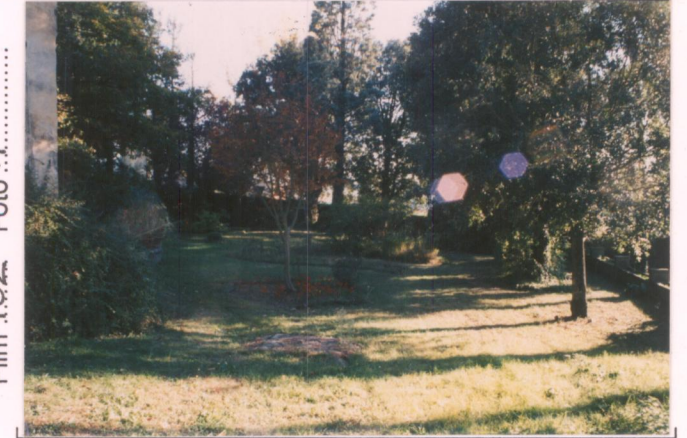
p.v. N. 4. Giardino formale (a sud).....