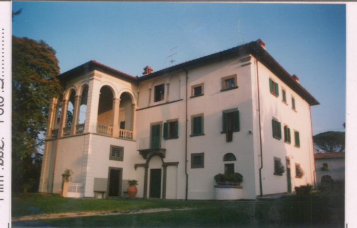
Film 662. Foto 3..... p.v. N. 4