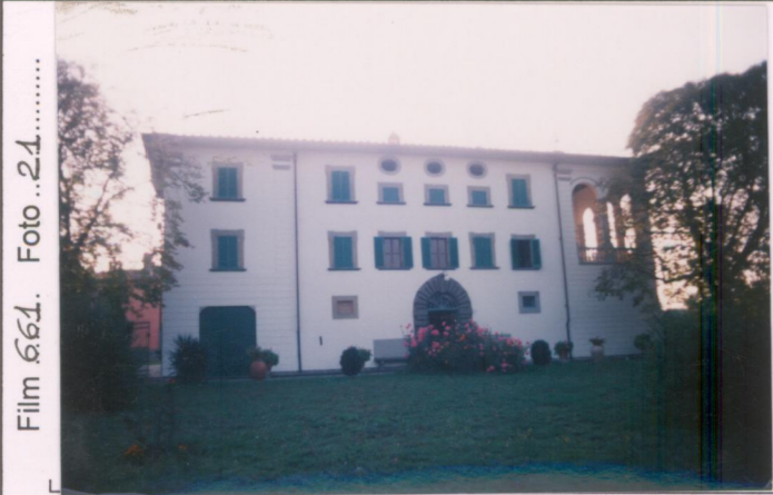
Film 661. Foto 21..... p.v. N. 1