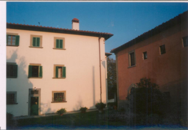
Film 662. Foto 4..... p.v. N. 3