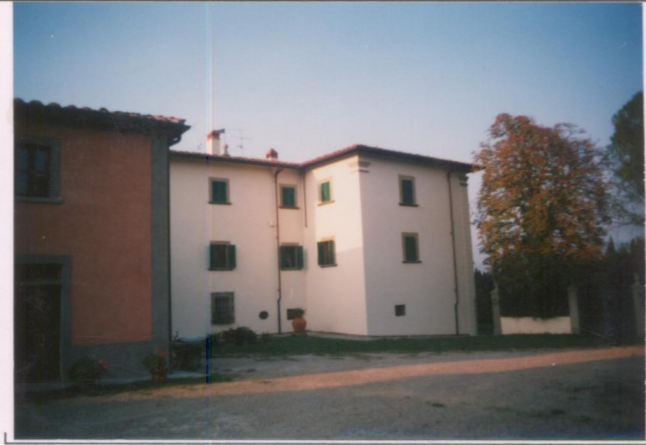
Film 662. Foto 5..... p.v. N. 2