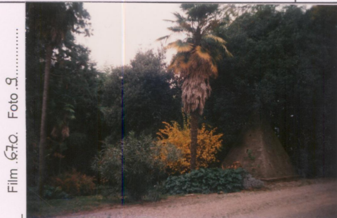
Film 670. Foto 9.....