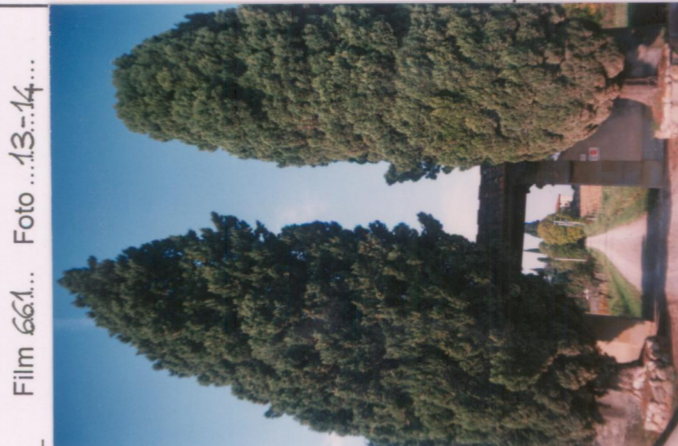
Film 661. Foto 13-14.....