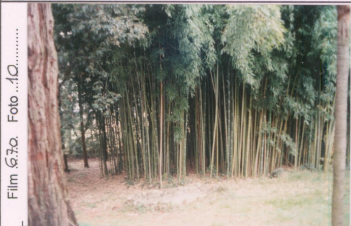
Film 670. Foto 10.....