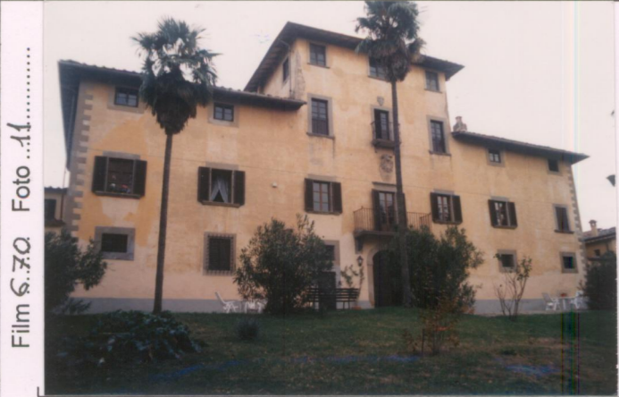
Film 6.70 Foto 11 p.v. N. 1