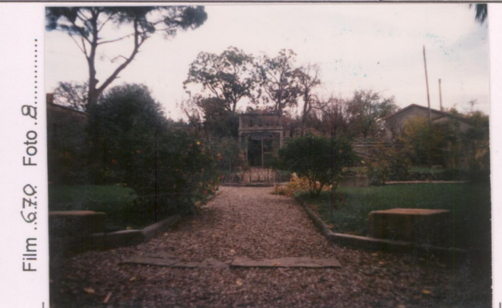
Film 6.70 Foto 8 p.v. N. 4