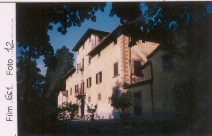
Film 661. Foto 12.....