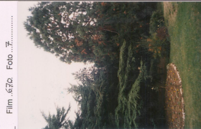
Film 6.70 Foto 7 p.v. N. 3