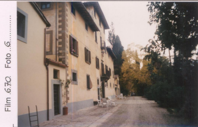
Film 6.70 Foto 6 p.v. N. 2