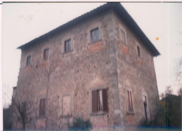
p.v. N. 4