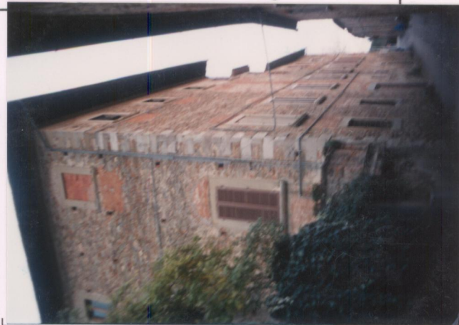
p.v. N. 2