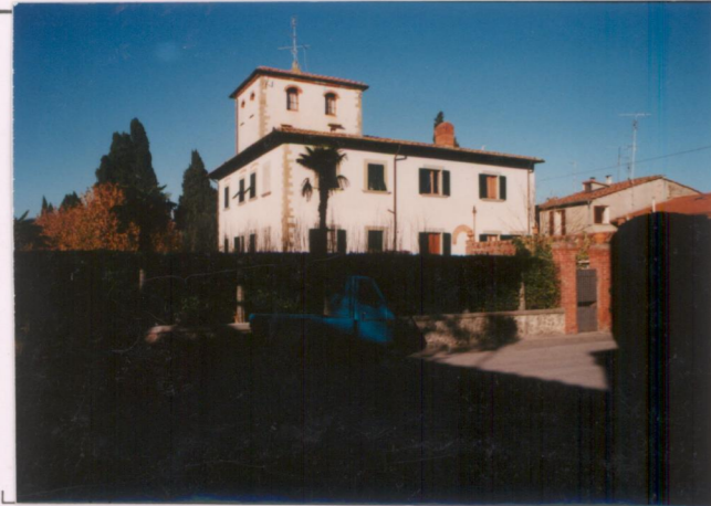
p.v. N. 1