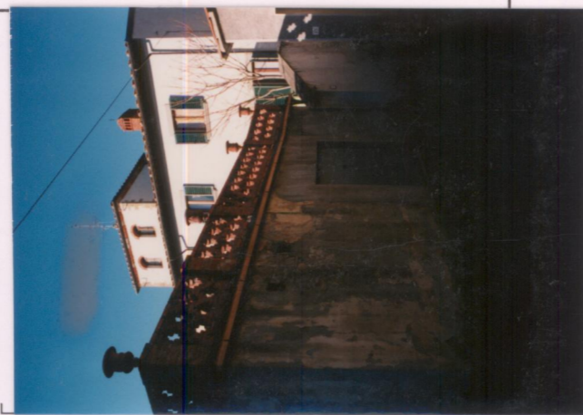
p.v. N. 2