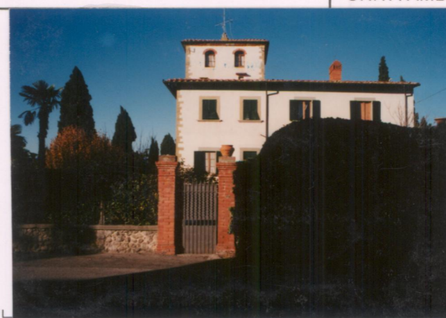
p.v. N. 3