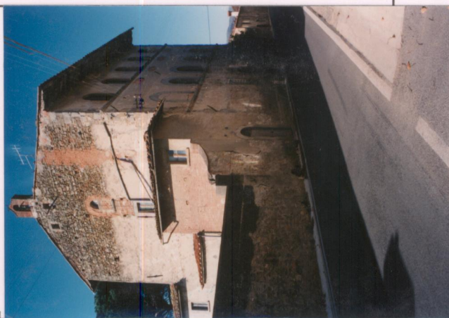
p.v. N. 6.....