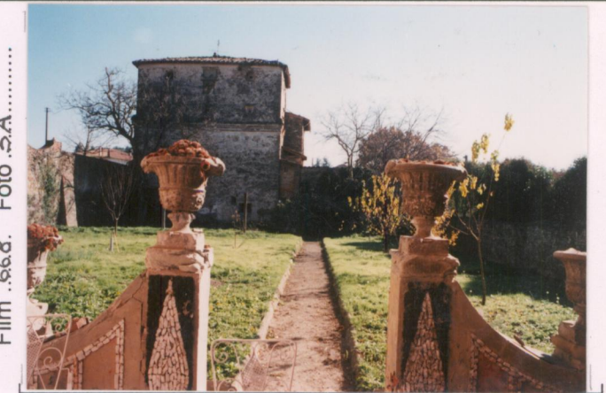
Film .668. Foto .3.A. .... p.v. N. 4.....