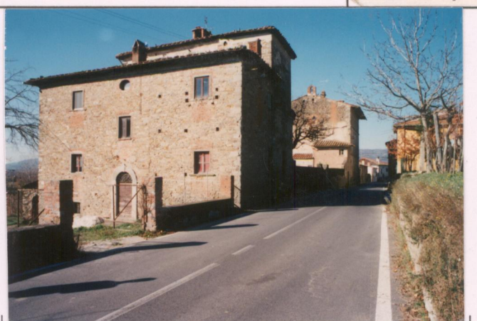
p.v. N. 8.....