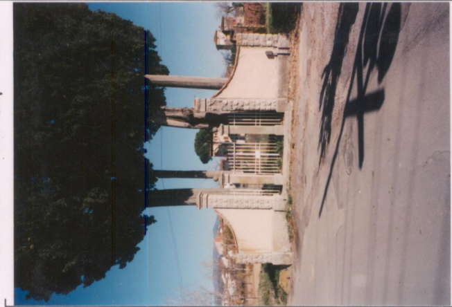
Film .668. Foto .0A. .... p.v. N. 2.....