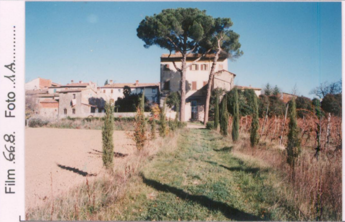
Film .668. Foto .1.A. .... p.v. N. 1.....