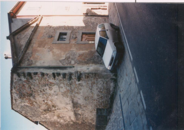
p.v. N. 7: la cappella, oltre la strada.....