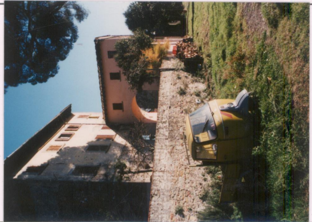
p.v. N. 5.....