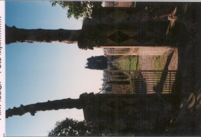
Film .668. Foto .4.A. .... p.v. N. 3.....