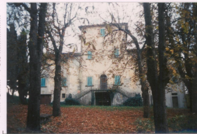
Film 670. Foto 17