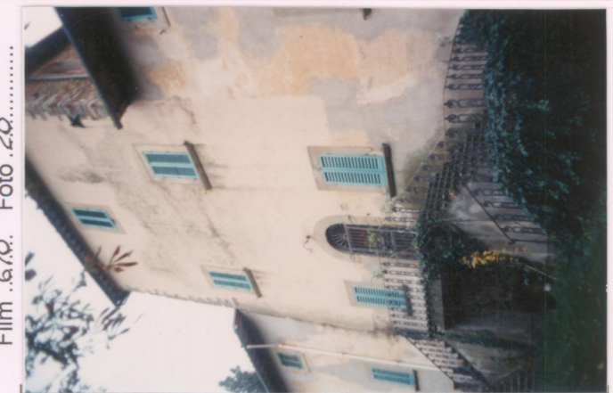
Film 670. Foto 20