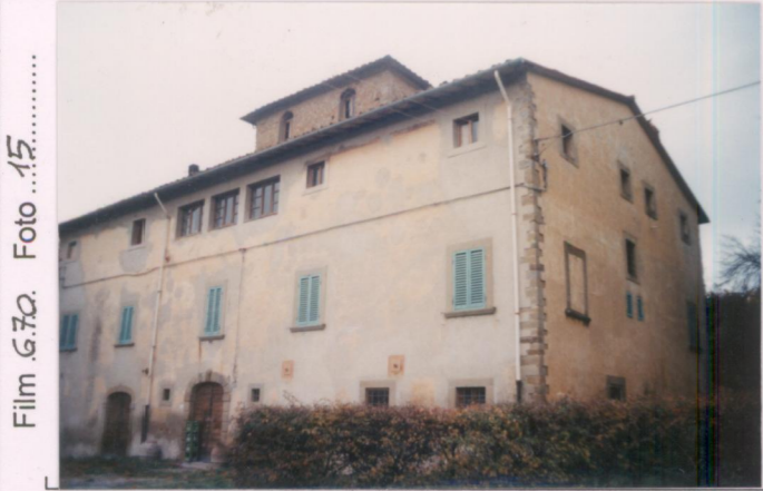
Film 670. Foto 15