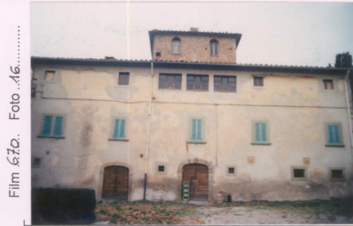
Film 670. Foto 16