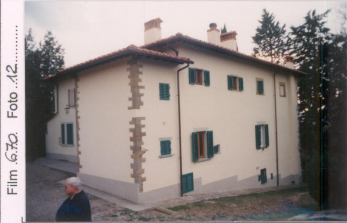
Film 670. Foto .12.....