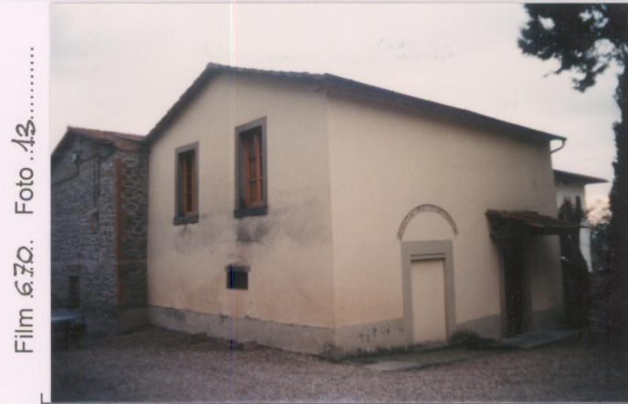
Film 670. Foto .13.....