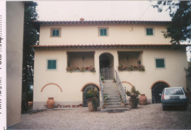
Film 670. Foto .14.....