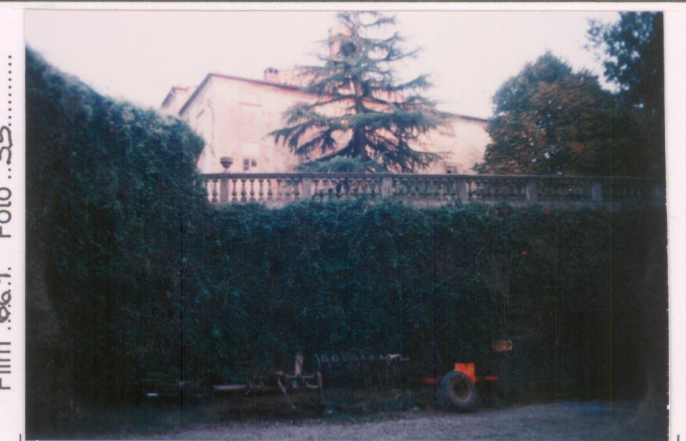
Film 66.1 Foto 35.....