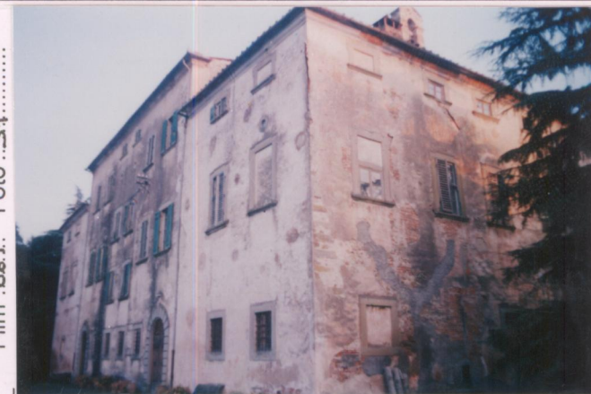
Film .661. Foto .34..... p.v. N. 2.....