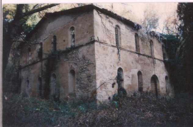
Il mulino Film: 65 Fot. 24A