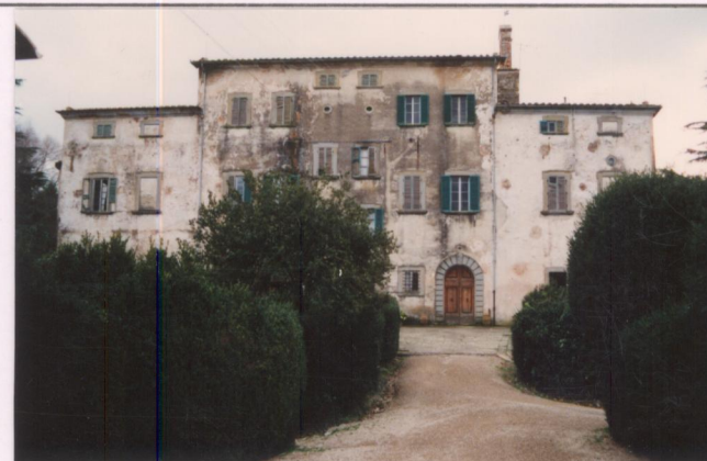
Film 64 Fot. 36