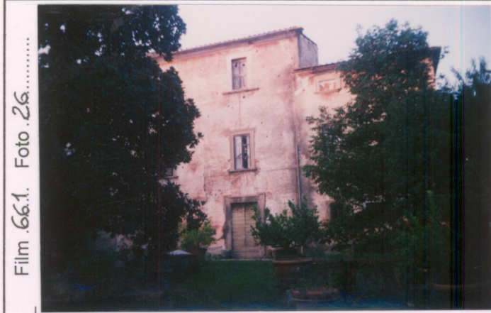
Film 66.1. Foto 26.....