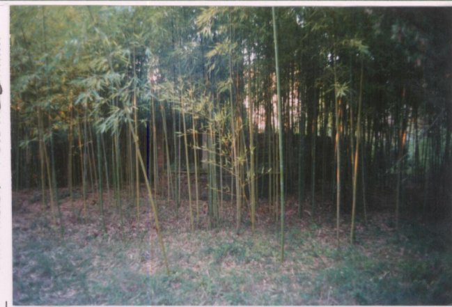
Film 66.1 Foto 28.....