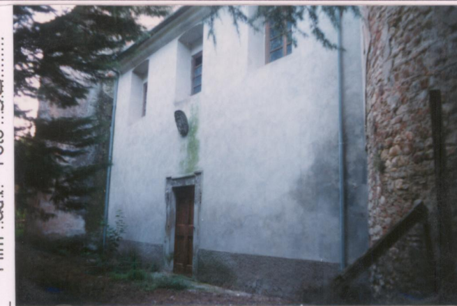
Film .661. Foto .32..... p.v. N. 3 : la Cappella con abside laterale.....