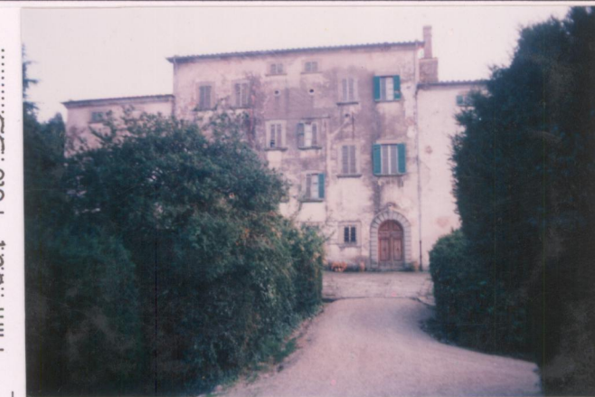
Film .661. Foto .33..... p.v. N. 4.....