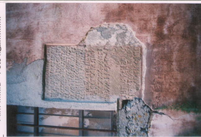
Film 66.1 Foto 29.....