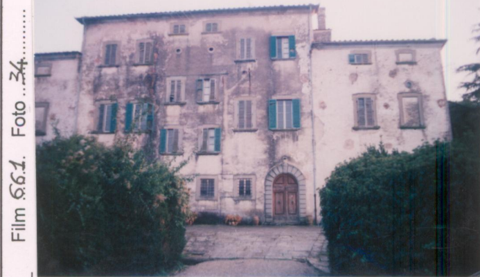
Film .661. Foto .34..... p.v. N. 1.....