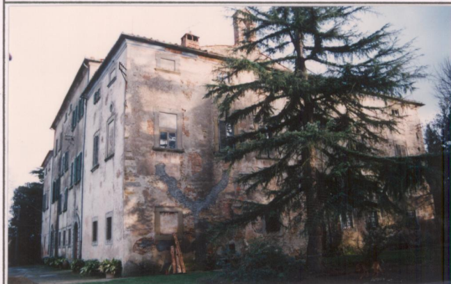
Film 65 Fot. 23A