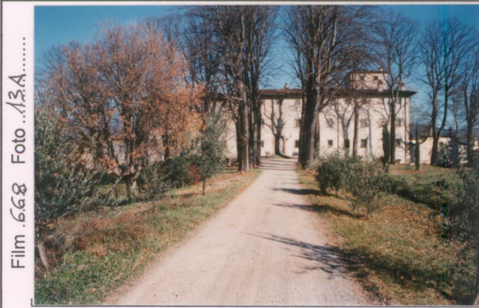
Film .668 Foto ..13A..... p.v. N. 1.....