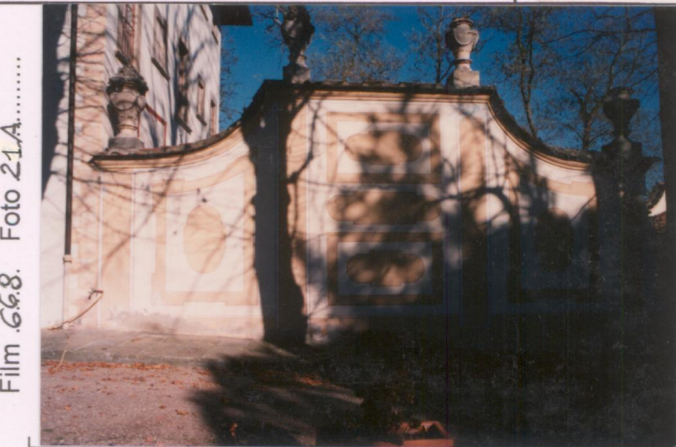
Film .668 Foto 21A..... p.v. N. 4.....