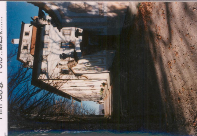
Film .668 Foto ..22A..... p.v. N. 3.....