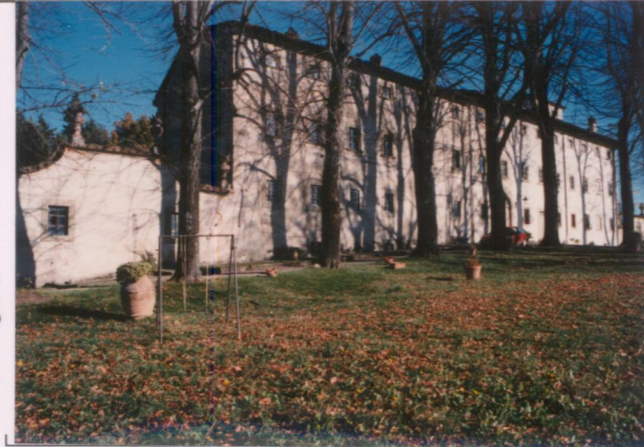
Film .668 Foto ..18A..... p.v. N. 2.....