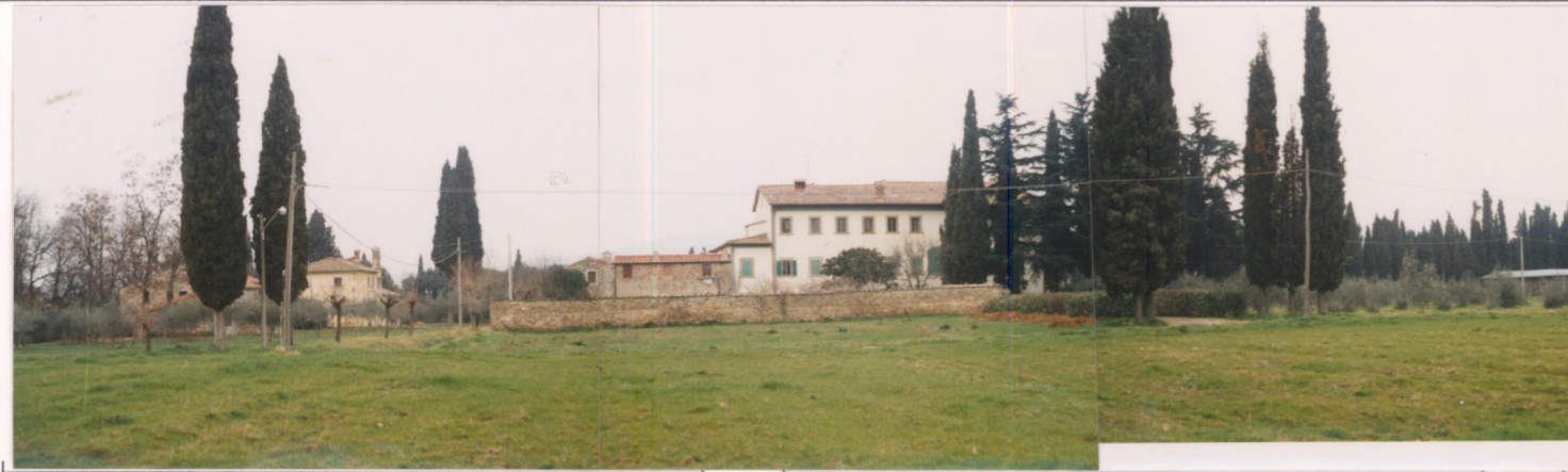
p.v. N. 1