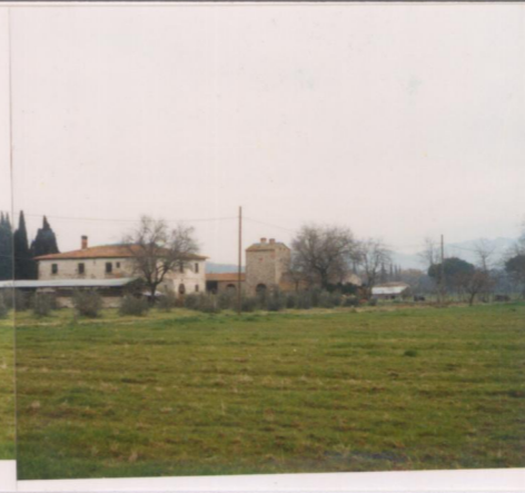
p.v. N. ....