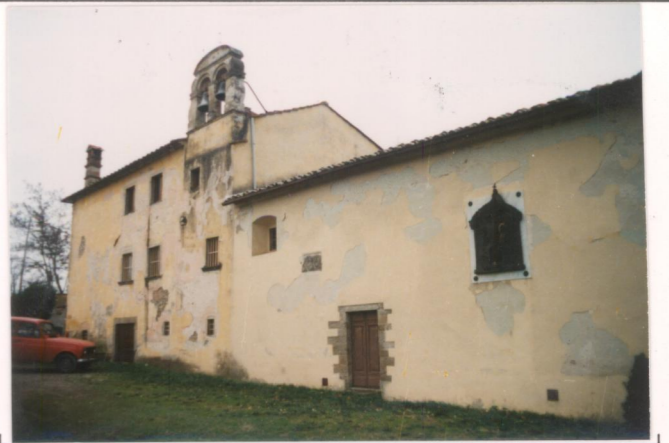
p.v. N. 2