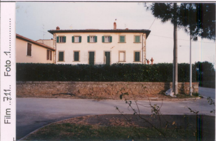
Film 7.11... Foto 1..... p.v. N. 1.....