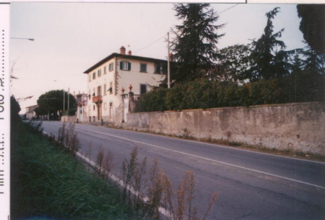
Film 7.11... Foto 5..... p.v. N. 4.....