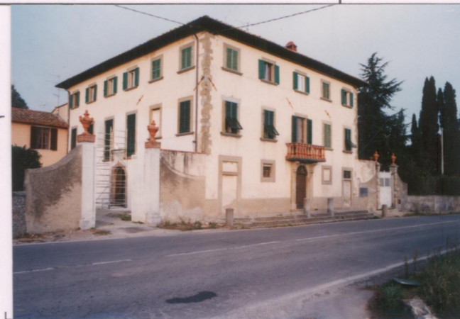
Film 7.11... Foto 4..... p.v. N. 3.....