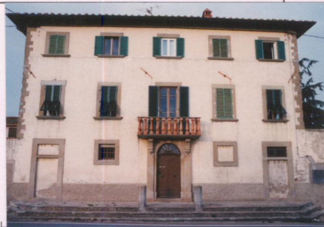
Film 7.11... Foto 3..... p.v. N. 2.....