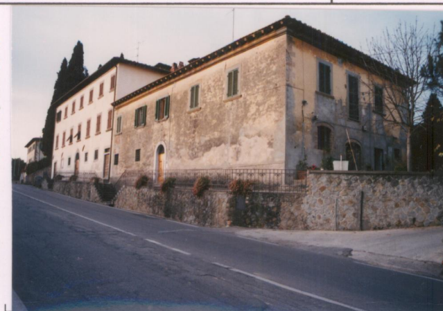
Film 7.11... Foto 41.....