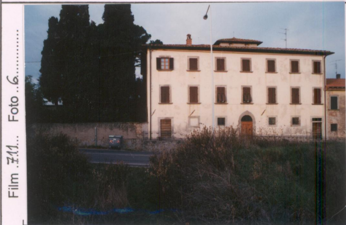
Film 7.11... Foto 6.....