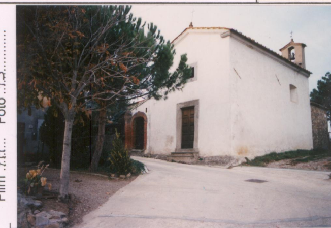
Film 7.11... Foto 13.....