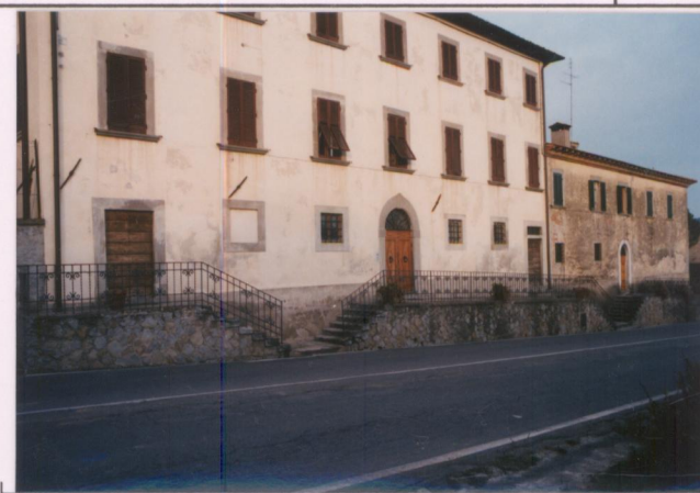
Film 7.11... Foto 10.....