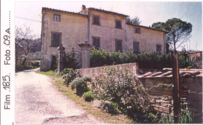
Film 185. Foto 09A