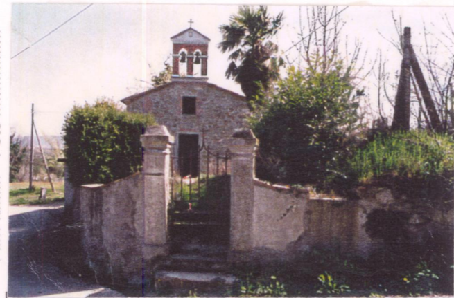
Film 185. Foto