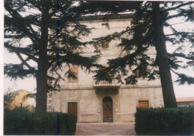
p.v. N. 2 Fronte principale