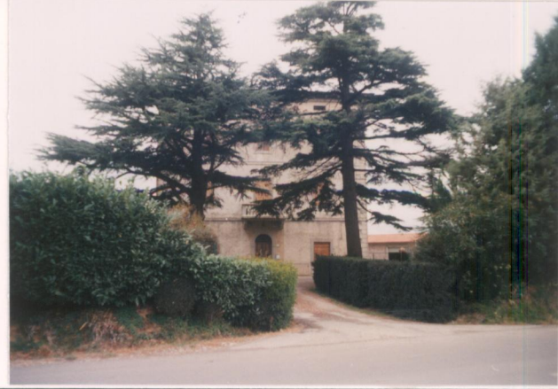
p.v. N. 1