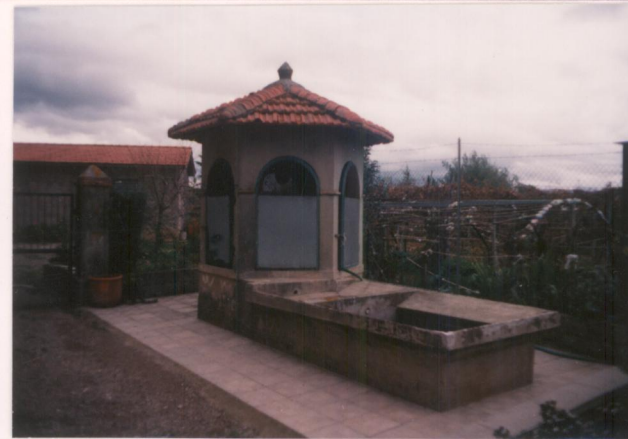
p.v. N. 3 Lavatoio e pozzo