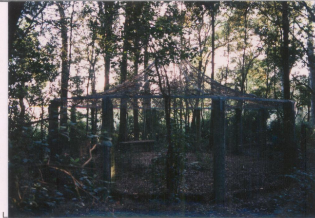
p.v. N. 3: Valiera