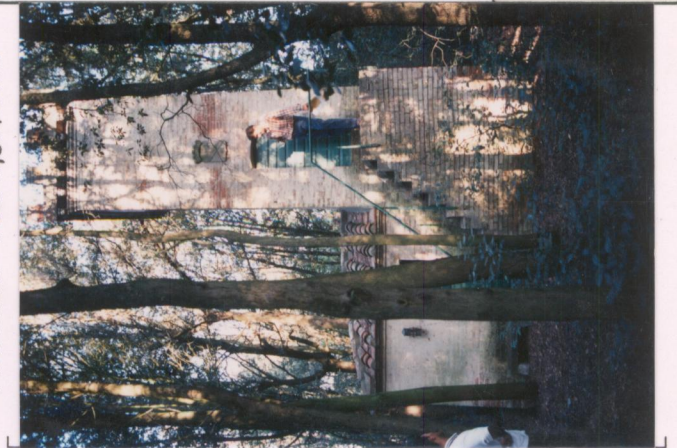
p.v. N. 4: torretta