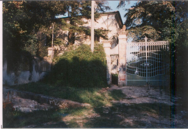
p.v. N. 1