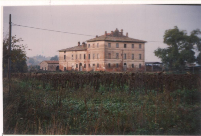
p.v. N. 3 : della Strada Statale