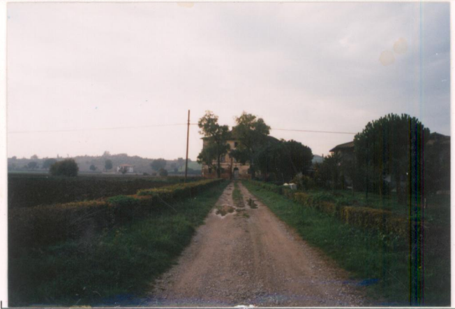
p.v. N. 1