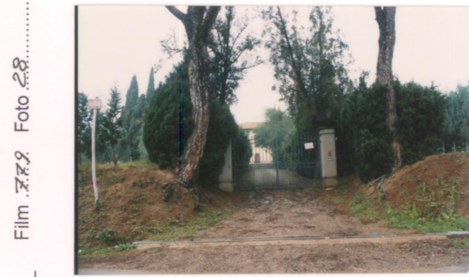
Film 779. Foto 28