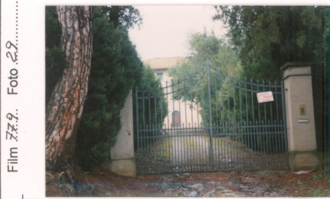
Film 779. Foto 27