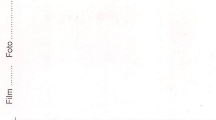
Film ..... Foto .....