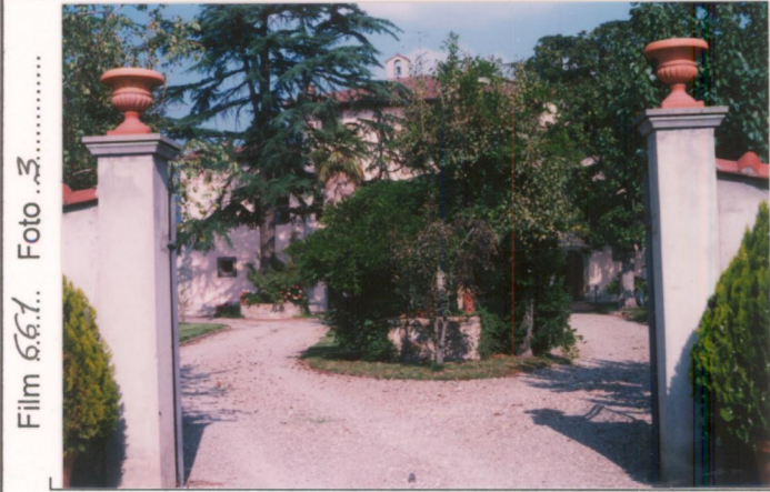
Film 66.1. Foto 3