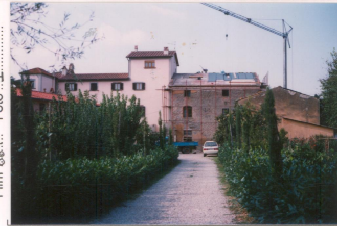
Film 66.1. Foto 4