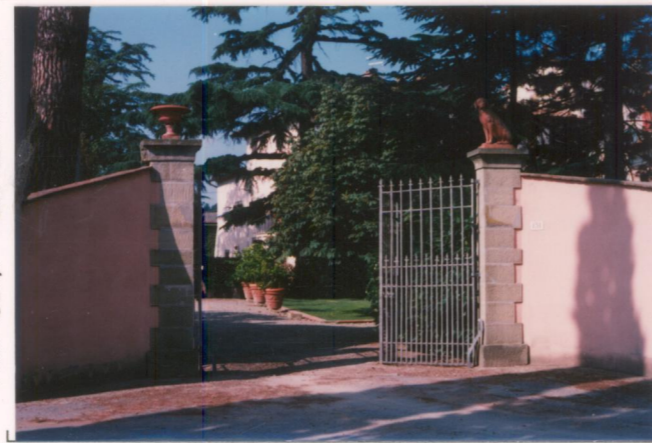
Film 66.1. Foto 2