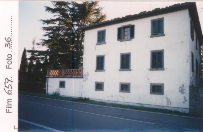
Film 659 Foto 36