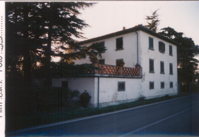
Film 659 Foto 35