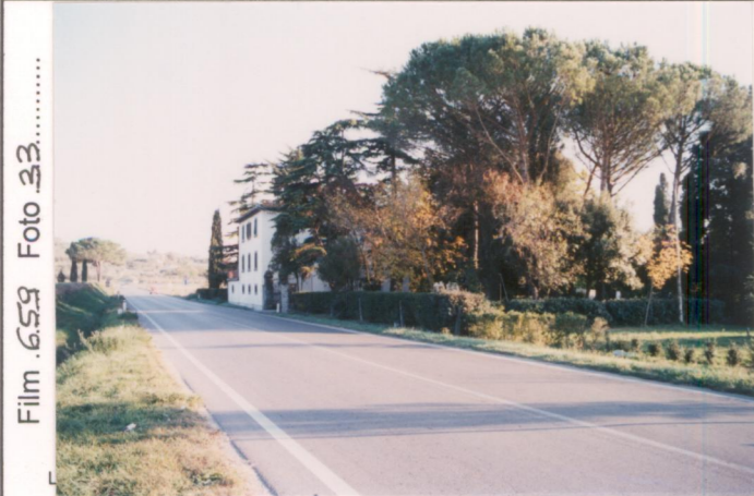
Film 659 Foto 33