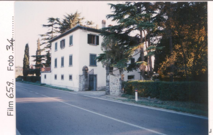
Film 659 Foto 34