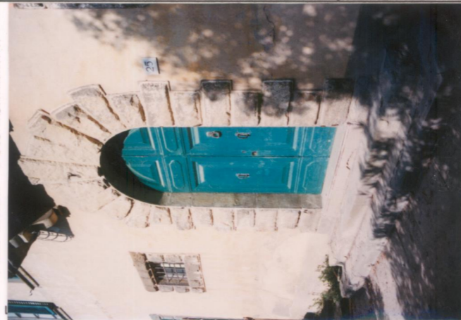
p.v. N. 3.....Il portale d'ingresso.....