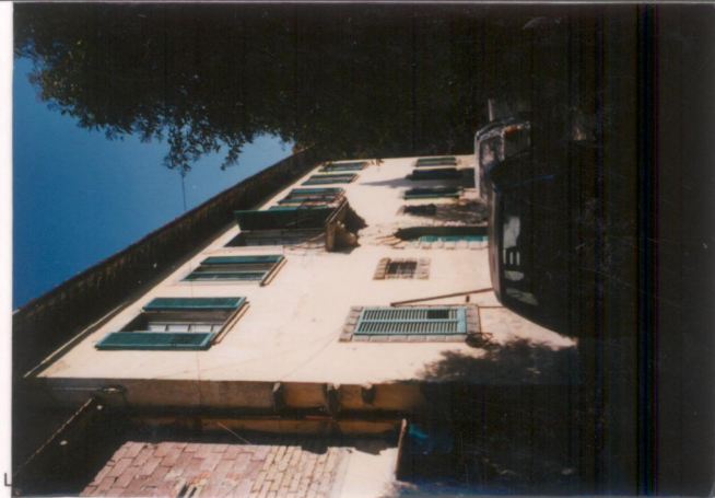
p.v. N. 1.....Fronte principale.....