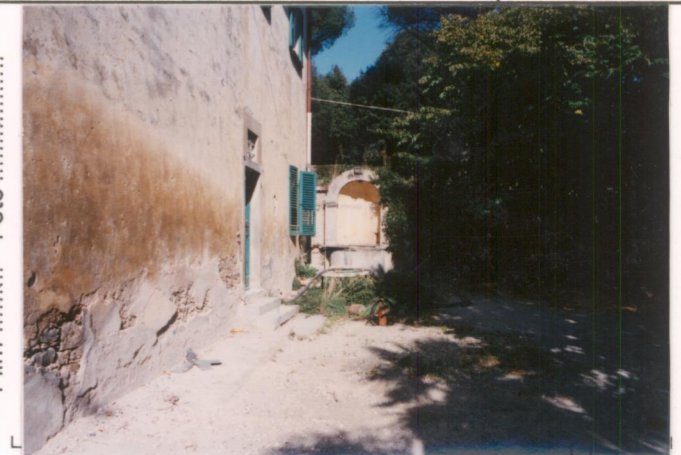
p.v. N. 4.....La nicchia addossata al muro di cinta.....