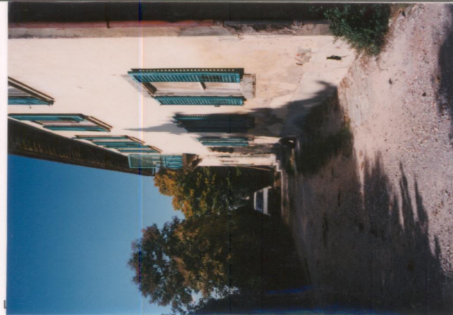
p.v. N. 2.....Idem; controcampo.....