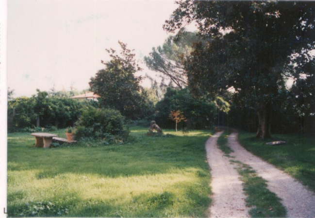
p.v. N. 7... Viale d'ingresso.....