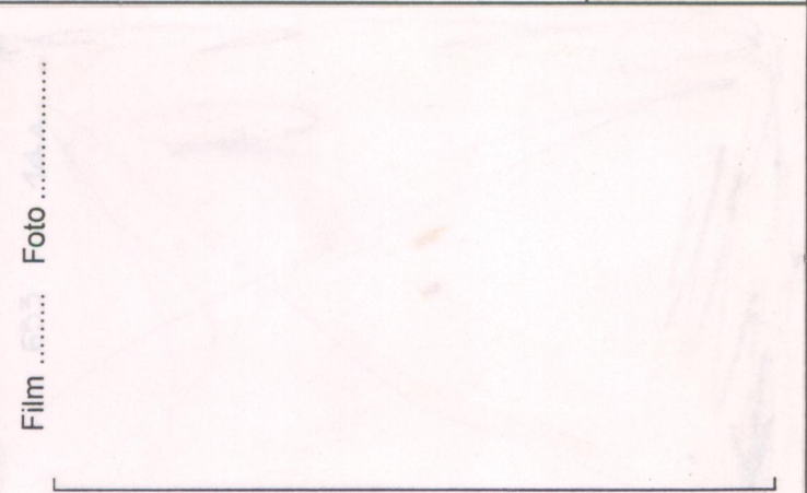
p.v. N. 4... Gli orti della villa