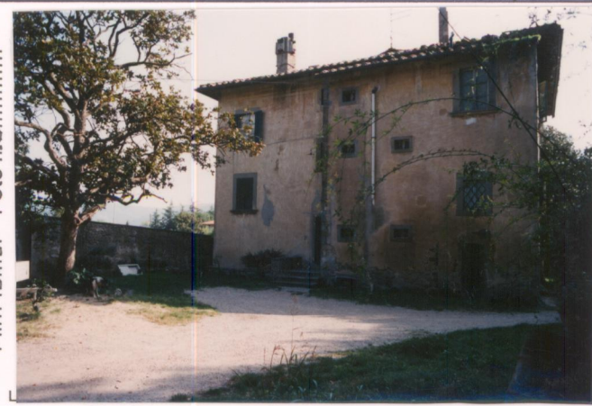
p.v. N. 2... fronte retro