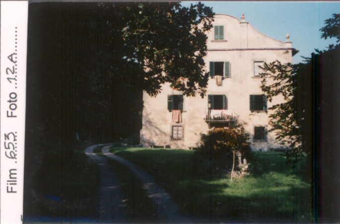
p.v. N. 1... Fronte principale