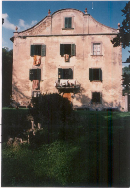
p.v. N. 5.....

Il fronte principale della villa con il caratteristico disegno tardo - settecentesco.