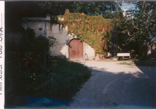
p.v. N. 3... La limonaia