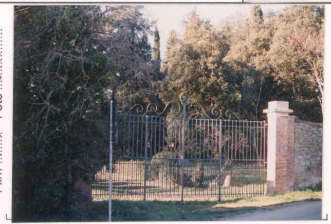
Film .714. Foto .05A.....