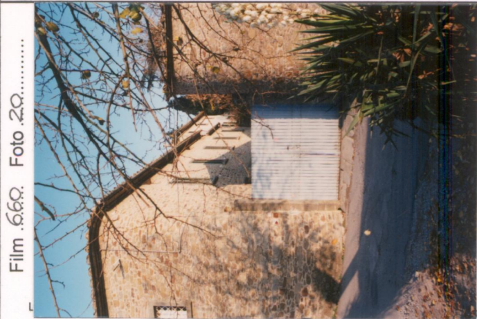
Film .669. Foto .20.....