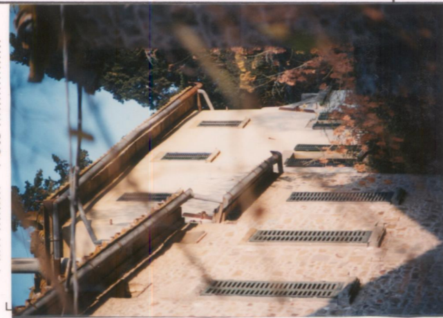
Film .669. Foto .27.....