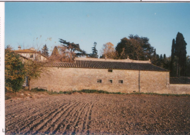
Film .669. Foto .21.....