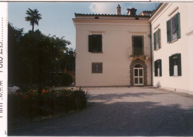
p.v. N. 4.....Particolare del corpo della villa.....