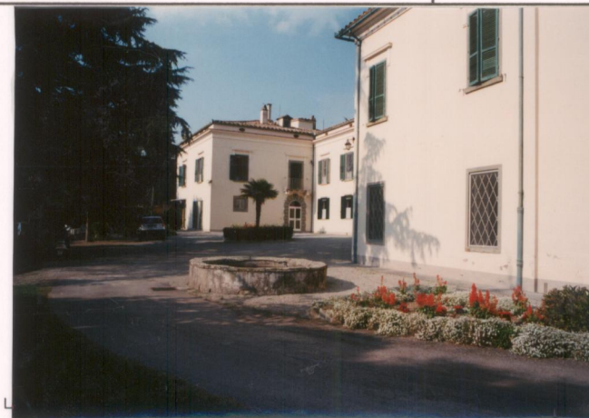
p.v. N. 3.....Veduta d'insieme, al centro la vasca d'acqua.....