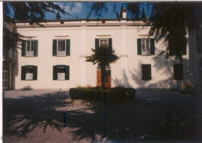
p.v. N. 2.....Fronte principale.....