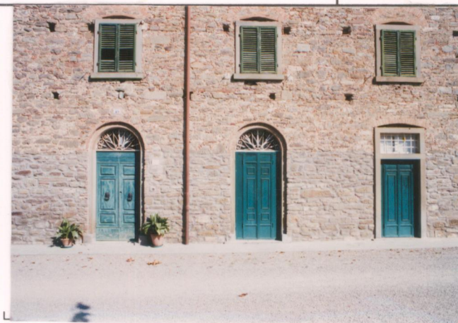
p.v. N. 3...particolare del prospetto principale.....