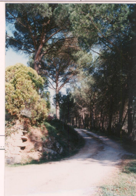
p.v. N. 8