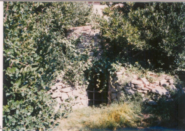
p.v. N. 7 La grotta