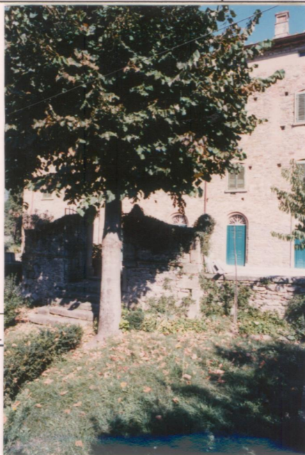
p.v. N. 6