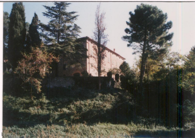
p.v. N. 1...veduta d'insieme.....