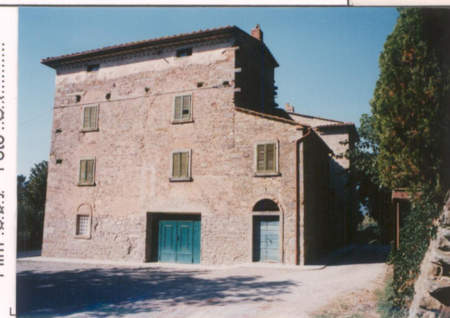
p.v. N. 4.....Prospetto laterale.....