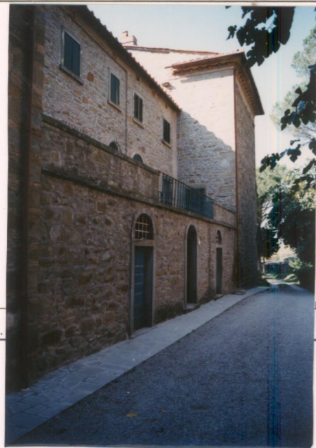
p.v. N. 5