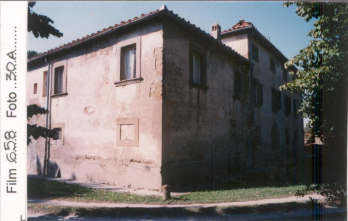
Film 658 Foto 30A..... p.v. N. 1. Prospetto principale, rivolto verso la S.P. Val di Pierle