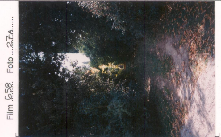
Film 658. Foto 27A..... p.v. N. 4. Un viale interno al parco