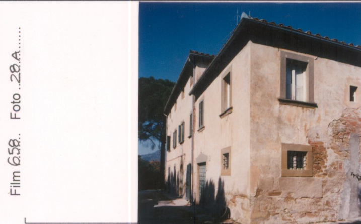
Film 658. Foto 28A..... p.v. N. 2. Retro