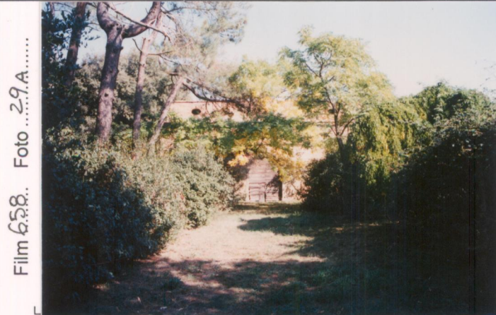
Film 658. Foto 29A..... p.v. N. 3. Un annesso in parziale abbandono