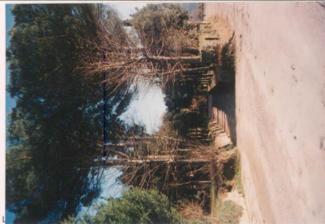
p.v. N. 2. Il viale alberato.....