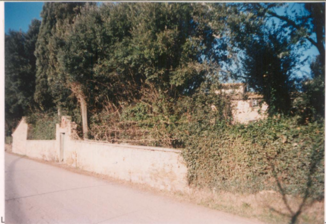
p.v. N. 3. Il muro di cinta lungo la strada.....