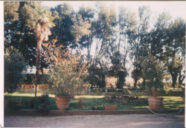
p.v. N. 4. Il giardino.....