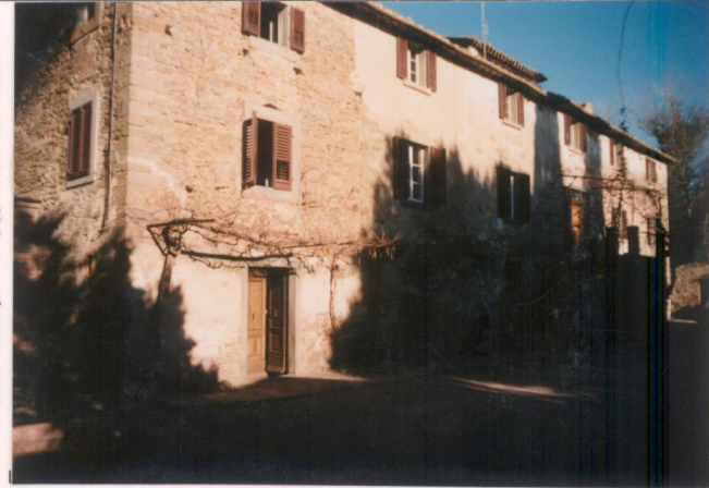
p.v. N. 1. Fronte principale della casa.....