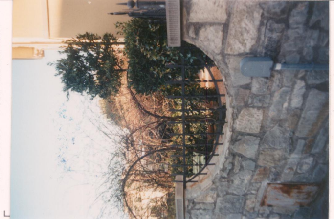
Film 7.14. Foto 31.A