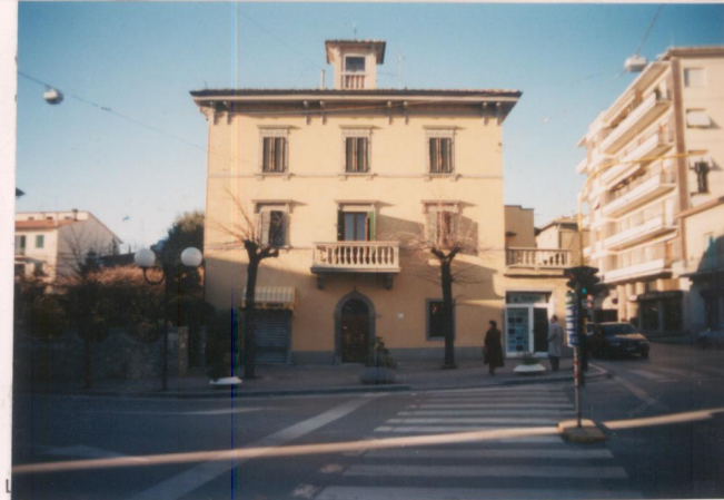
Film 7.14. Foto 29.A