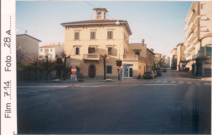
Film 7.14. Foto 28.A