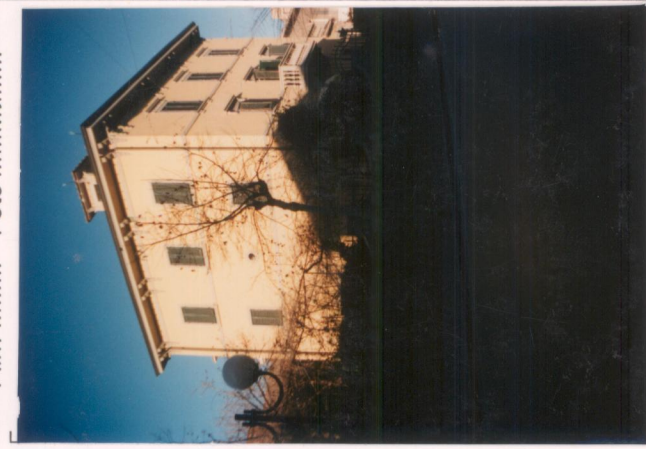
Film 7.14. Foto 30.A