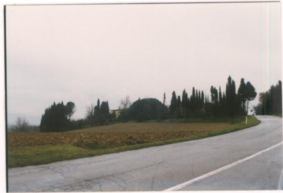
p.v. N. 1