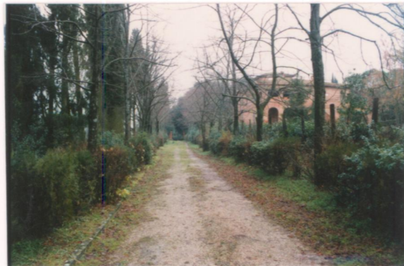
p.v. N. 2