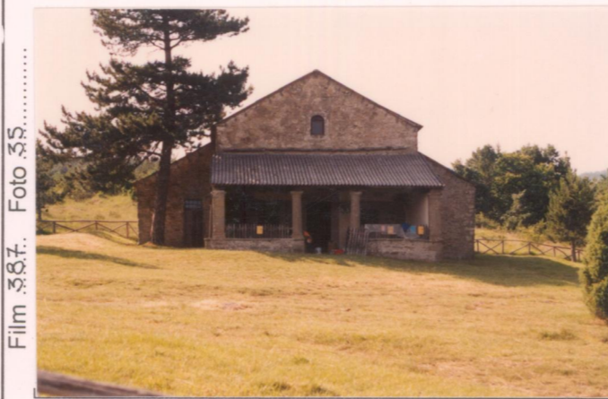
Film 357. Foto 35