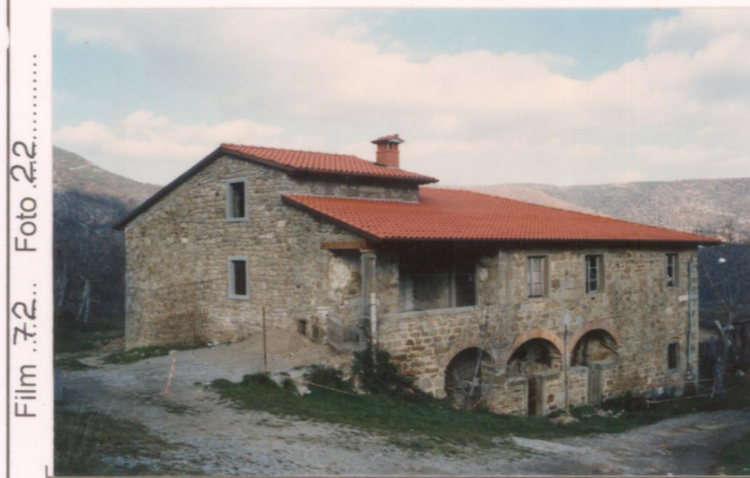
Film 7.2... Foto 2.2